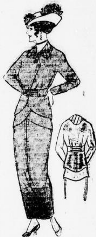
Jacken-Kleid schwarz-weiss kariert, auf Futter, Schatten-Kragen, mit Seidenband-Garnitur . . . . . 27.00