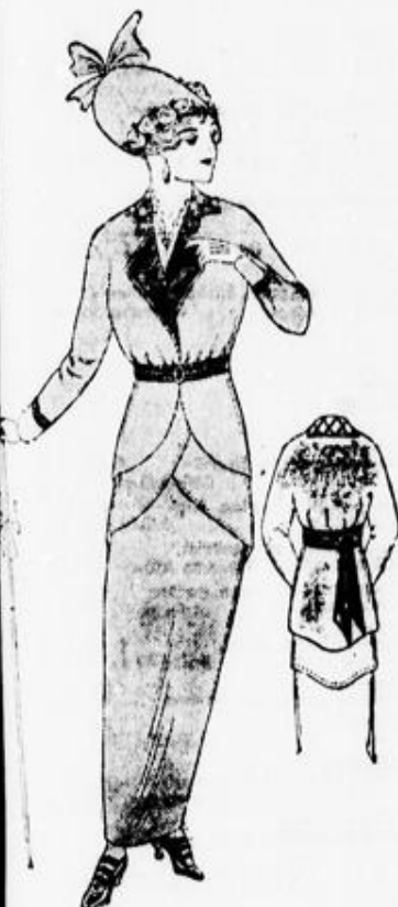
Schickes Jackenkleid 4 Gabardine, Coteló, Kammgarn, auf Seide, in den neuesten Farben . . . . . 32.00