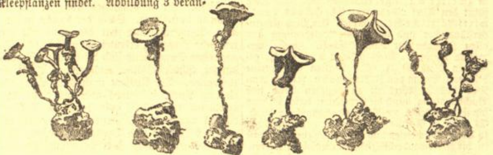
Abbildung 2. Gequante Sklerotien mit Apophysen.