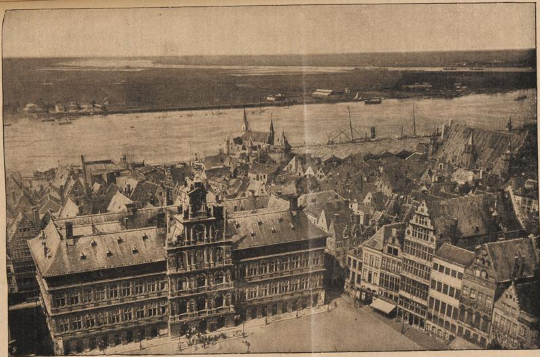
Ansicht von Antwerpen: Blick von der Kathedrale auf die Stadt.