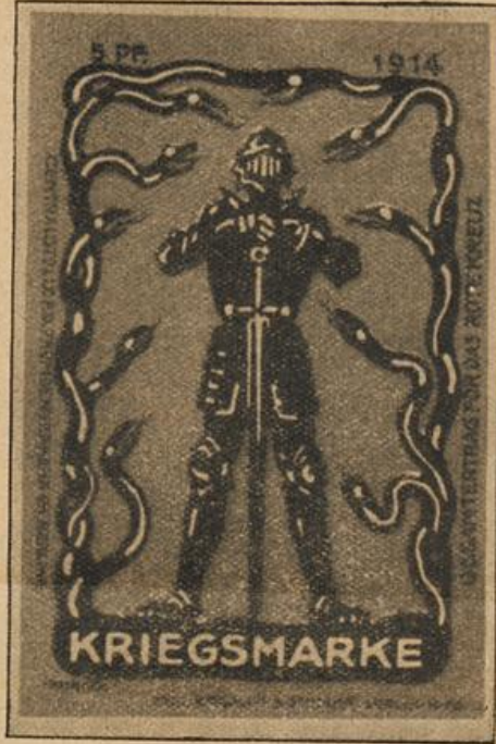
Kriegsmarke zum Besten des Roten Kreuzes. Entworfen vom Maler Julius Klinger.

in Südafrika der niedrige offene Kragen bereits auf dem Wege schien, sich durchzusetzen. Die Feldmütze wird für den geübten Soldaten, der gewohnt ist, der Sonne ausgesetzt zu sein, als ein genügender Schutz ein leichter Schlapphut aber als noch zweckmäßiger bezeichnet. Die Engländer, die an ihrer Landarmee in den letzten Jahren viel herumgedoktert haben, waren danach also noch immer nicht am Ende der Aufgabe gelangt, eine gesundheitsgemäße Art der Ausrüstung zu finden, sind vielmehr über ein Versuchen nicht hinausgekommen.