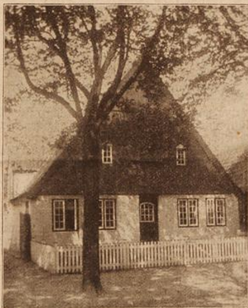
Das Klaus-Groth-Museum in Heide (Holstein). (Mit Text.)

Was alles in jenen Minuten durch mein schwirrendes Hirn wirbelte — ich kann es nicht sagen! Die Gedankenfragmente irrten sowild und toll durcheinander, daß sich momentan kein eigentlicher Begriff formulieren konnte. Blitzartig huschten die Gestalten der Passagiere, der Leute an mir vorüber, der Gedanke etwa noch an die teuere Ladung. Dann zuckte es schmerzhaft in meinem Herzen: mein Frauchen — mein armes Frauchen!