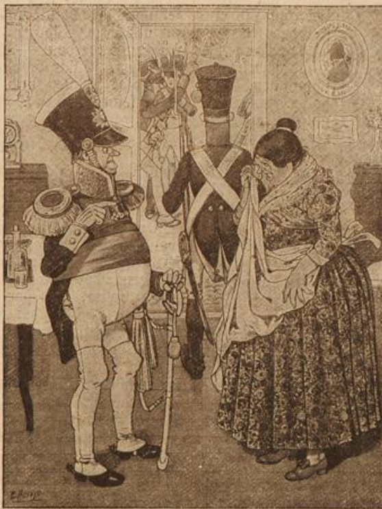
Aus der guten, alten Zeit. Hauptmann, zum Kampf aufbrechend: „Eindemwirtin — heut wird's ernst — wer weiß, ob wir uns lebend wiedersehen; auf alle Fall' brate Se mir 'n schönen Godel zum Mittagessen.“

Ein Klaus-Groth-Museum ist neulich in Heide (Holstein), dem Geburtsort des plattdeutschen Dichters, eingeweiht worden. Sein Vaterhaus, das abgerissen werden sollte, wurde von der Stadt angekauft, renoviert und eingerichtet. Eine noch in Heide lebende Halbschwester des Dichters konnte genaue Anweisungen geben, wie es früher, zu des Dichters Lebzeiten, im Hause ausah, und so konnte etwas Rechtes geschaffen werden. Groths Werke, viele seiner Schriften, seine vollständige Bibliothek und manches, was mit ihm in Berührung gestanden hat, konnten in dem Häuschen untergebracht und dadurch der Charakter eines Groth-Museums gewahrt werden.