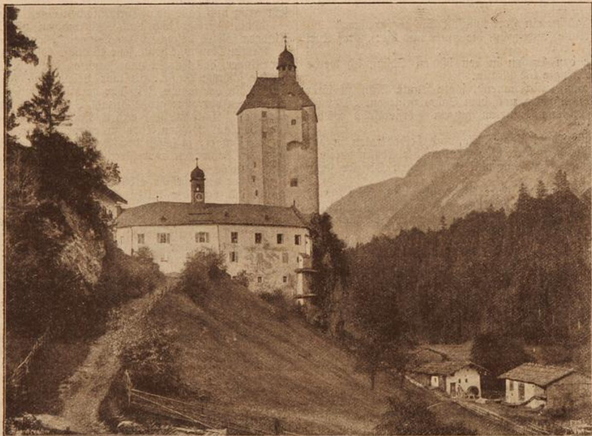
Mariastein im Unterinntal. (Mit Text.)

„Ullakind“, sagte die Tante wie in früheren Zeiten, „hast du etwas auf dem Herzen, dann nur herunter damit. Du weißt,