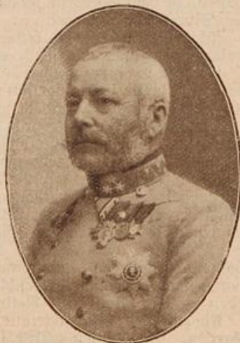
Erzherzog Friedrich von Oesterreich. (Mit Text.)

Die Barren — die Klippen, auf welche die „Henny“ nun unweigerlich in toller Fahrt zutrieb — barmherziger Himmel! — die mußten unser aller Untergang werden. Und ich konnte nichts — nichts tun, um das Unheil aufzuhalten, lagen wir doch schon dicht davor! Aus fünf, sechs Kehlen dröhnte es da auch bereits: „Brandung voraus!“ Ja, die hörte ich zu mei-