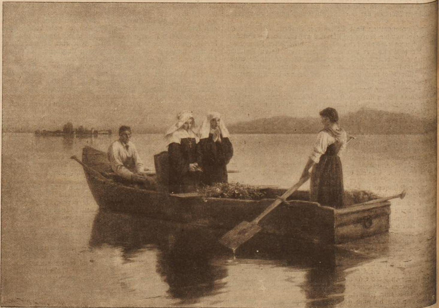
Abendgloden. Von J. Wopfner. (Mit Text.)

Sobald mein gutes Schiff nun wieder am Kurs lag, bemühte ich mich festzustellen, wo es sich eigentlich befand. Ich konnte das