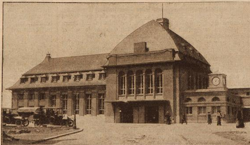
Der neue Bahnhof in Höchst a. M., der kürzlich dem Verkehr übergeben wurde.