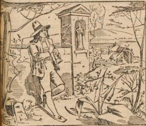
Wo ist mein Affe?

die beiden für immer versunken. — Da! Plötzlich hob sich Arm aus dem Gischt, dem Schaum, dann ein Kopf — etwas davon ein dunkles Fell — zappelnde Glieder. Und das riß jetzt ein donnernder Wasserberg himmelan und landete im nächsten Augenblick hoch auf den Felsen.