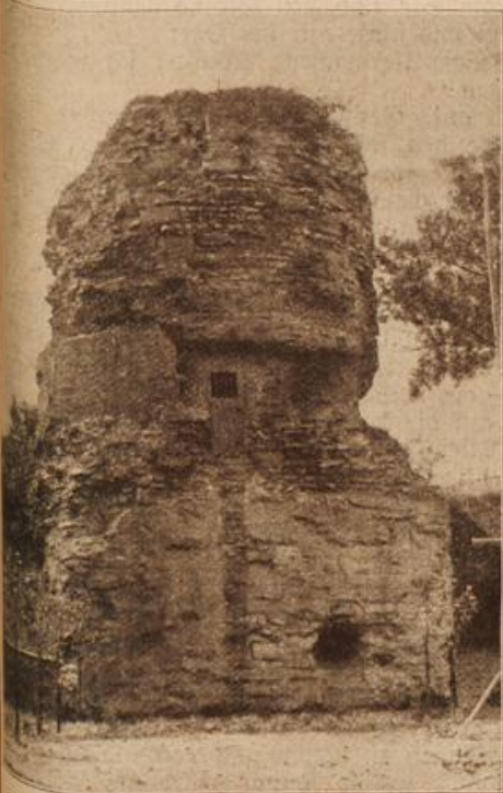
Das Trujosdenkmal auf der Mainzer Zitadelle. (Mit Text.)

Es war inzwischen ziemlich dunkel geworden und meine Angst