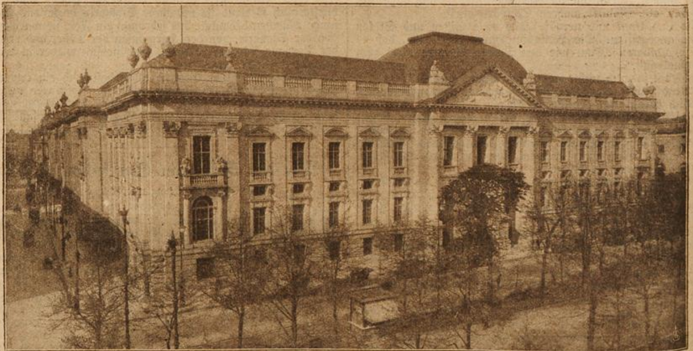
Neubau der königlichen Bibliothek in Berlin. (Mit Text.)

keine Gelegenheit habt, weder die einen noch die anderen zu gebrauchen. Ihr scheint zu glauben, daß der Kaiser vor Euch steht. Tut das lieber nicht und betrachtet mich nur als Herrn Rudolf, einen Ritter, der mit einem andern ein bißchen plaudern will.“