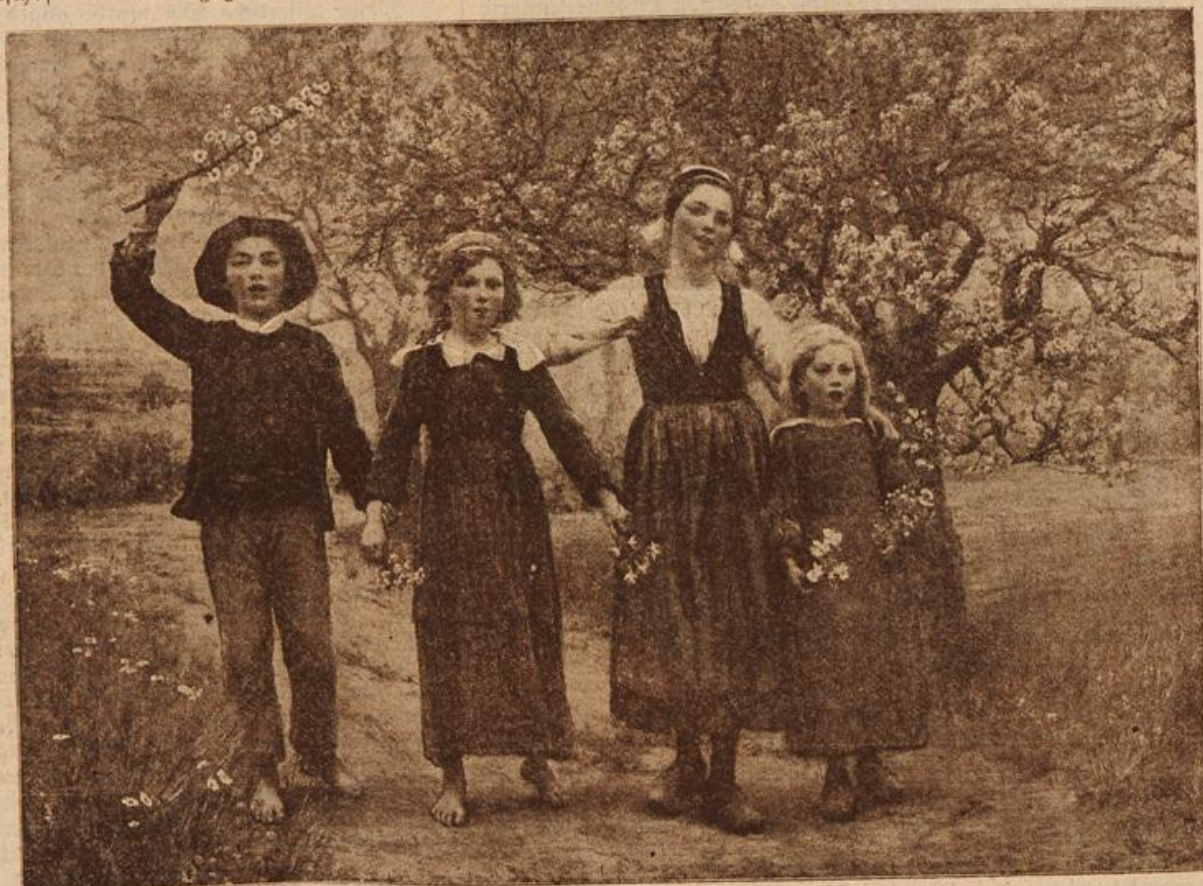
Frühlingslied. Von L. Dehrolle. Verlag von Braun, Clément & Co., Dornach i. E. (Mit Gedicht.)

Es machte dem Kaiser Mühe, den strengen Ausdruck in seinem Ge-