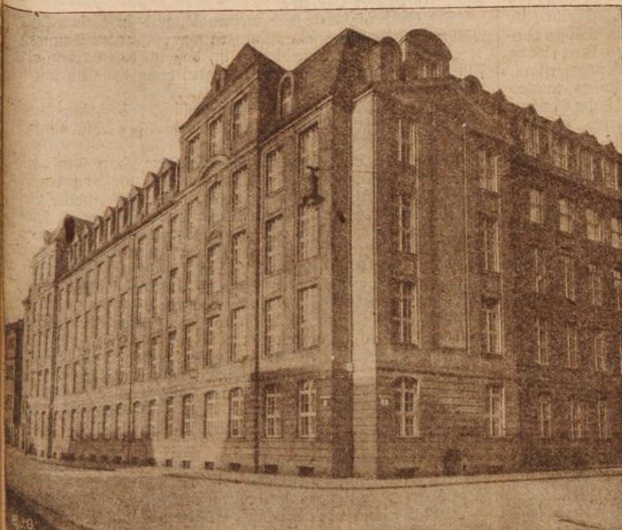
Die Handels-Lehranstalt in Dresden. (Mit Text.)

Der Graf mußte lachen, und sein Lachen befreite ihn von seiner Befangenheit, in der er sich in Gegenwart des hohen Herrn immer noch befunden hatte. „Um Euer Majestät die Wahrheit zu gestehen, muß ich sagen, daß es mir leid tut, ihn so behandelt zu haben. Ich hätte ihn bitten sollen, den Platz zu räumen, aber mein Arm ist immer rascher bei der Hand als meine Zunge, wie Ihr selber ja schon bemerkt haben werdet.“