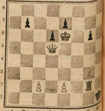
Weiß. Matt in 4 Zügen.

Von E. Ferber in St. Amarin (Deutsche Schachzeitung 1913) Schwarz.