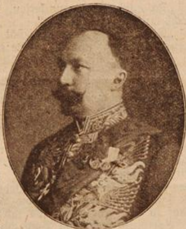
Der neue russ. Finanzminister Carl. (Mit Text.)

„Sehr klug wäre das, und Ihr, der Ihr nicht feig seid, der sich nicht fürchtet, im Kampfe irgend-einem Wesen aus Fleisch und Blut gegenüber zu treten, Ihr gäbet zu, daß es Fälle gibt, in denen Ihr Euer Heil