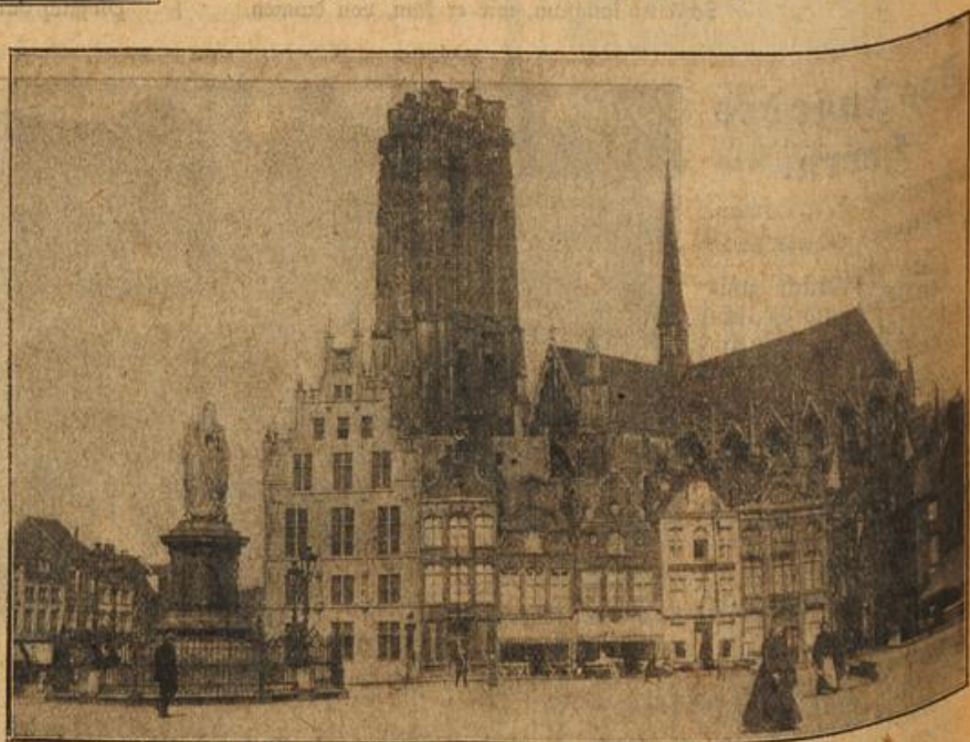
Die altberühmte Kathedrale zu Mecheln.

„Ach, der gute Wolf —“ in Annemaries blaue Augen trat ein warmer, freundlicher Ausdruck, als sie des alten Freundes gedachte. Es war zwischen Malchentin und Schlarentin im letzten halben Jahre eine kleine Entfremdung eingetreten, seit damals, als Wolf in der ersten Zeit von Koczjerowski's Sier sein etwas abfällig über diesen geurteilt hatte. Sie hatte ihm