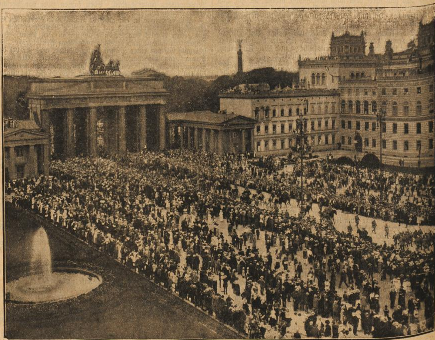
Der Einzug der ersten erbeuteten belgischen, französischen und russischen Kriegstrophäen auf dem Pariser Platz in Berlin