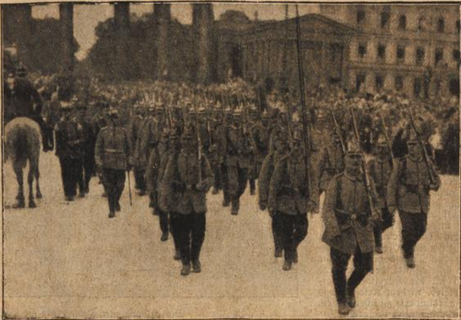
Einzug der ersten Kriegstrophäen in Berlin.

„Donnerwetter, Herr von Koczjerowski — Glück im Spiel, Unglück in der Liebe! Sie räubern uns ja geradezu aus!“ Der Oberförster machte seinem verärgerten Herzen gegenüber seinem präsumtiven Schwiegerohn durch diesen Zwischenruf Luft. Die beiden Nichtspieler sahen nach dem Spiel sich hinüber, wo Jan von Koczjerowski eben die Bank hielt. Neben ihm lag schon ein angenehliches Päckchen Schokolade und ein hübsches Häufchen Gold,