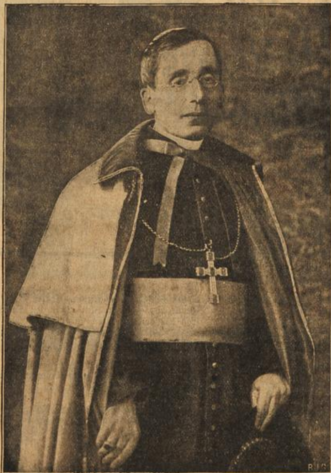
Benedikt XV., der neue Papst.

Zwei Tage später rollte ein leichter Jagdwagen vor die Rampe des Malchentiner Herrenhauses. Es geschah so selten,