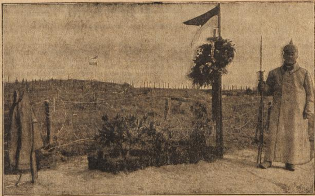
Das Grab eines deutschen Dragoners bei Lüttich.