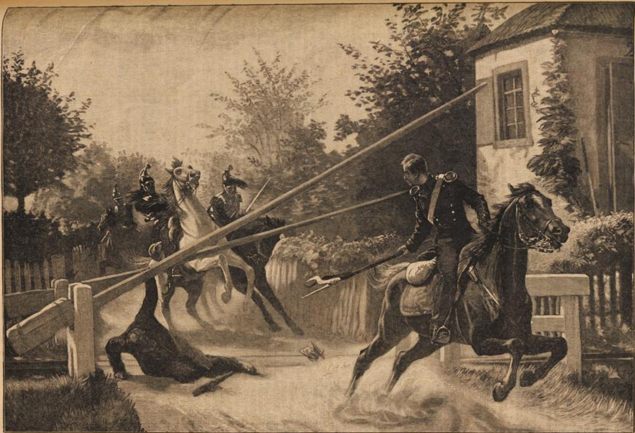
Durch! Nach dem Gemälde von A. v. Roegler.