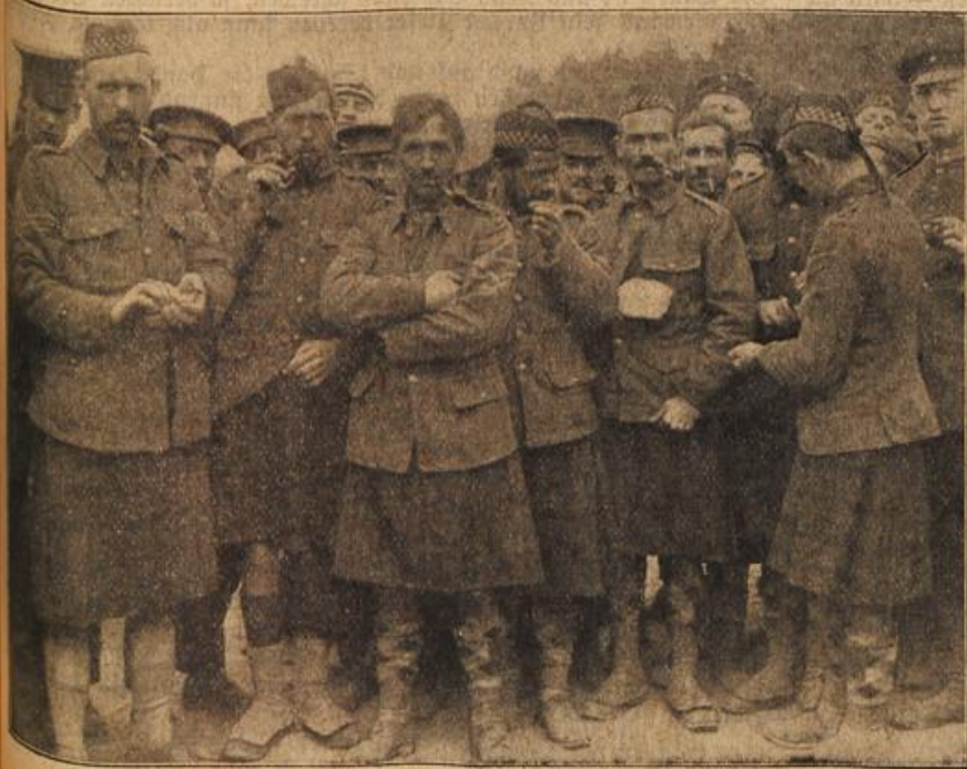
Gefangene Hochländer in ihren eigenartigen Uniformen.

Ein Teil der bisher gefangenen englischen Soldaten wurde auf dem Truppenübungsplatz Doberitz in einem Zeltlager untergebracht. Unter den Gefangenen fallen besonders die Hochländer in ihrer eigenartigen Uniform auf. Man kann aber bemerken, daß gerade sie sich äußerst bergnügt in ihr Schicksal fügen.