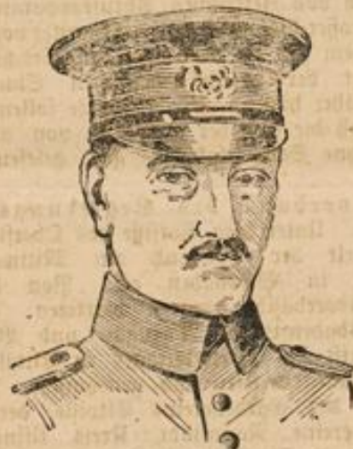
Oberst Thomson †

Nach Holland unterwegs ist die Leiche des in Albanien gefallenen Obersten Thomson. Ein Bruder des Verstor-