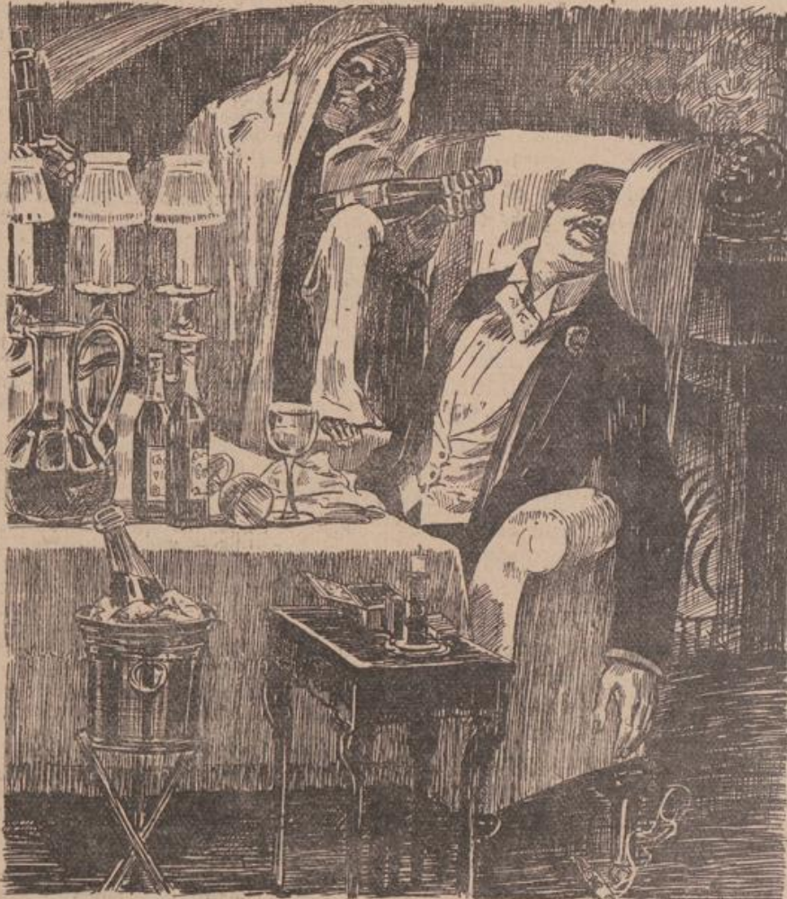
Der Tod und der Zecher.

das Tun und Lassen der Menschen. „Wer auf das Fleisch sät, wird vom Fleisch das Verderben ernten,“ dies unumstößliche Gesetz bleibt; und hinter den schweren Vorhängen und blendenden Lichtern, hinter den Sekt- und Kognakflaschen, hinter dem üppigen Mahl und neben dem weichgepolsterten Lederstuhl lauert der Sensemann, der Tod — und wenn er einschenkt, dann ist's der letzte Trank. Dann heißt das Aufwachen beim reichen Mann des Evangeliums und bei dem reichen modernen Schlemmer in Frack oder Smoking: „Als er in der Hölle und in der