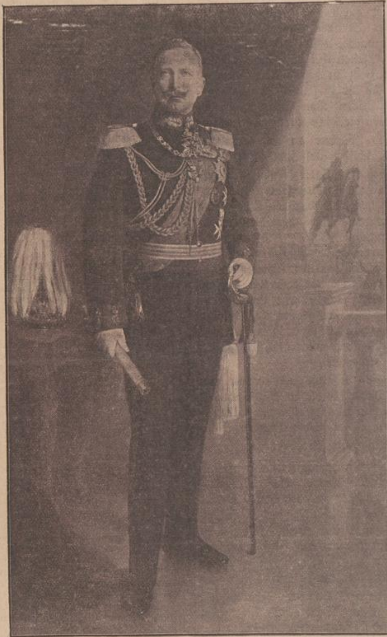
Kaiser Wilhelm II. □

fromm und fest, erleuchtet, die Schäden zu erkennen und mit fester Hand zuzugreifen und zu heilen. Betet um diese Gaben für das geliebte Haupt des Landes. Aber auch darum, daß seine Obersten und alle Ratgeber, Minister und Beamte mit Festigkeit und starker Hand regieren, Zucht und Ordnung nach Gottes Wort und in Gerechtigkeit wahren und eifern durch-