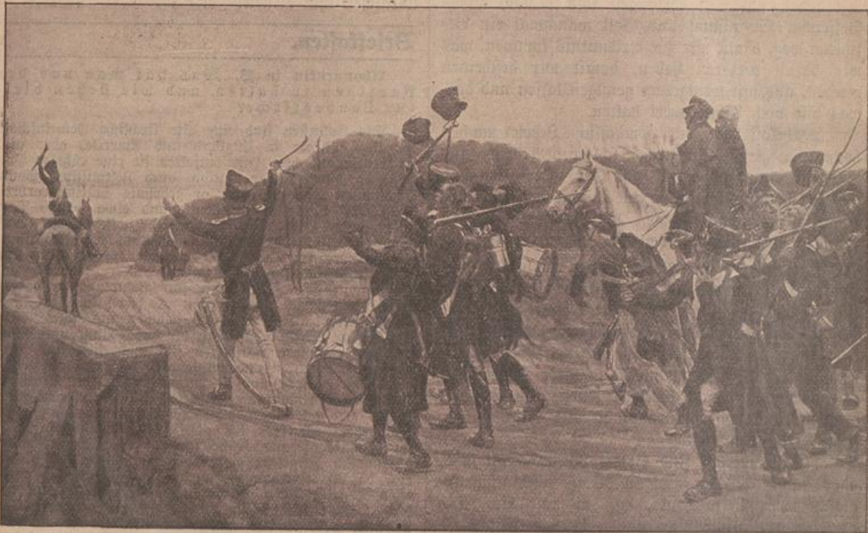
Der Vortrupp Blüchers erblickt den Rhein bei Caub.

Mit freudigem Herzen begrüßen wir so alle Mitstreiter und Mitpilger, ihnen des Herrn Segen und Gnade fürs neue Jahr wünschend. Möget ihr alle rechte Fortschritte machen und wachsen in der Erkenntnis Jesu Christi. Dazu will unser Blatt mithelfen. Es hat eine immer wichtiger und ernster werdende Aufgabe in der jetzigen Zeit. Es dient mit als Damm gegen die Gottlosigkeit, als Stärkung für den alten liebwerten Glauben. So viele Familien und einzelne brauchen einen Freund wie unser Blatt, das ihnen einen Halt und den rechten Blick fürs Zeitliche und Ewige gibt. Wer bringt