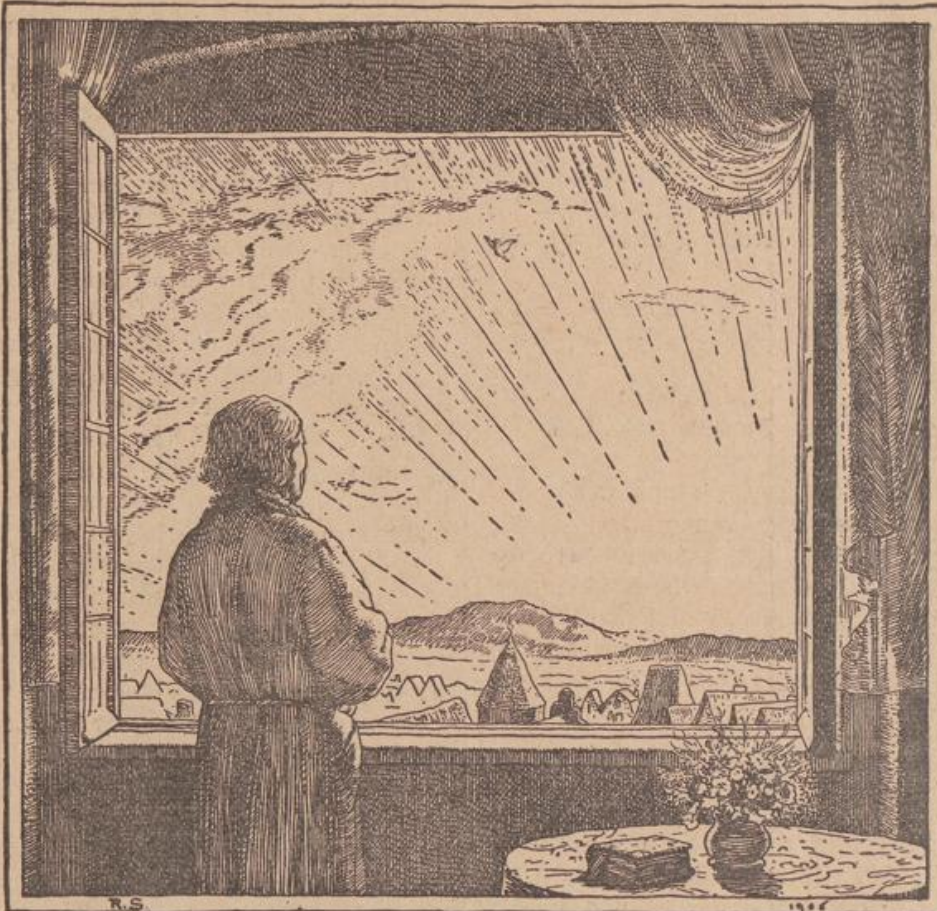
Der Morgen naht.

Religion und Sitte schreiben vor, daß der Vater so frühzeitig wie möglich seinem Sohne eine Gattin kaufe; nach ihrem Aberglauben zieht das Unterlassen dieser Pflicht dem Schuldigen ewige Strafe im Jenseits zu, aber auch schwere Vorwürfe im Diesseits. Die jung getrauten Frauen pflegen erst, wenn sie 10—12 Jahre alt sind, zu ihren Gatten zu ziehen; bis zu dieser Zeit halten sie sich in dem Haus ihrer Eltern auf. Es gibt in Indien Millionen Mütter im Alter von 13 Jahren und Großmütter von erst 25 Jahren. Das Los dieser Frauen ist außerordentlich traurig; schon die Geburt eines Mädchens wird als Strafe betrachtet, da man ihm ja eine Mitgift verschaffen muß. Trotz größter Strenge der Gesetze und äußerster Wachsamkeit der Polizei ist der Mädchenmord in Indien sehr häufig. Die verheiratete Frau führt ein Sklaven-dasein, die Witwe ein noch traurigeres Leben, weil man glaubt, daß alle Leiden, die sie erduldet, dem verstorbenen Gatten zum Glück gedeihen. Den Witwen bleibt oft