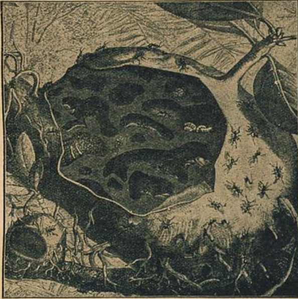
Abb 1: Ein Ameisenneft auf einem Baum.

Das war die Glocke der Kirche zu Kemel, die nicht lange danach durch die Werthschen Völker von Grund aus zerstört wurde, so daß man nur noch ein Weniges von dem Turme sah.