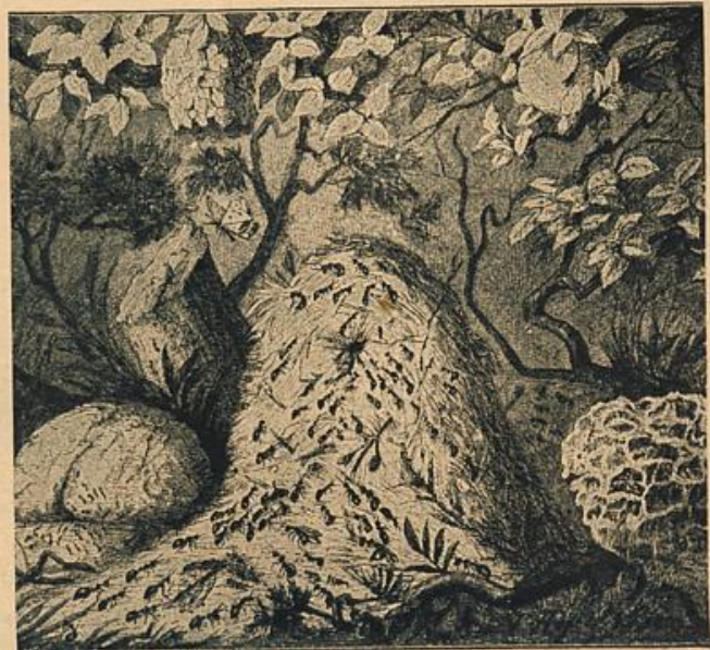
Abb. 3: Das Äußere eines Ameisennestes.

Und so wuchsen zu jener Zeit die Pflanzen ins Riesenhafte. Farn- und Schachtelhalme von 10 Meter Höhe, Schuppen-