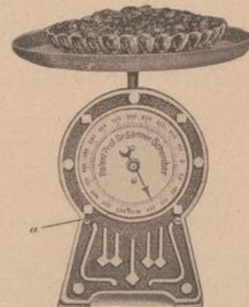
Abbildung 3. Gefäß mit 300 gr Speise belastet.