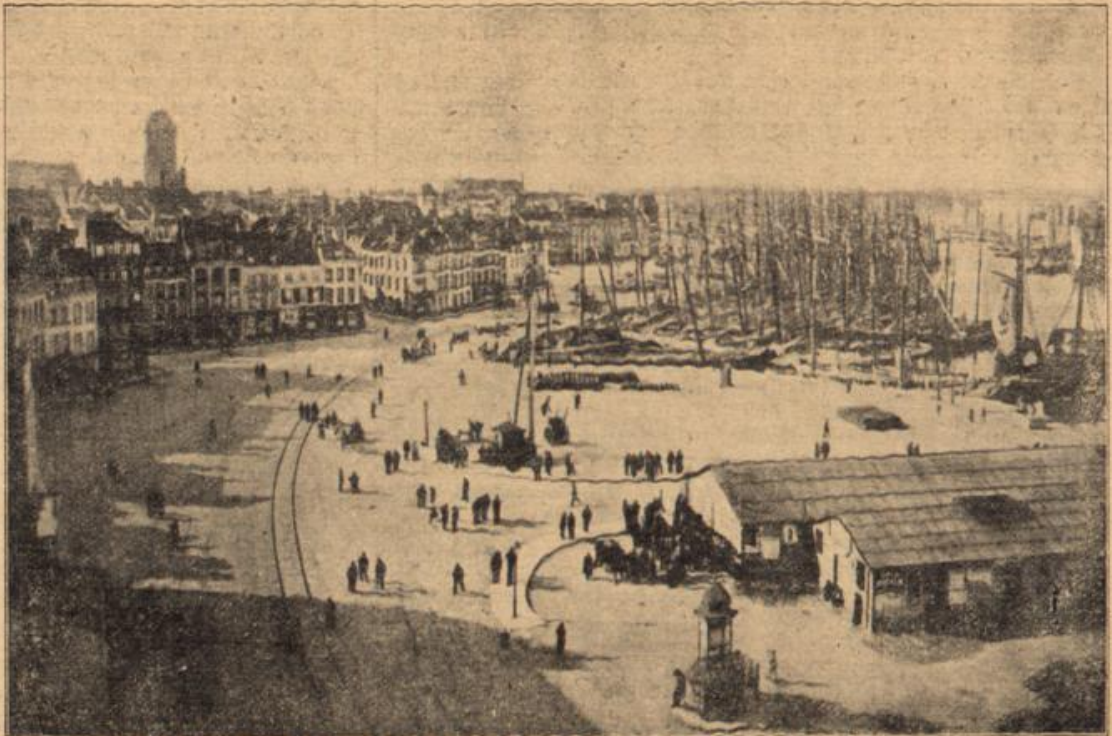
Blick auf den Hafen von Dünkirchen.

Aber noch fürchte ich nichts, ich hoffe noch das Beste. In der Villa ist es nun ganz still geworden. Vor zwei Tagen ist Bruno nach Berlin zurückgekehrt; und heute folgt ihm Baroness Mia nach. Unter dem Siegel der Verschwiegenheit vertraue ich Dir etwas an, was ich freilich nur aus gewissen Andeutungen Deiner Tante erraten habe. Wie es scheint, soll es zunächst noch Geheimnis bleiben. Mein Tattgefühl verbietet mir, Deine Tante direkt zu fragen. Es scheint also, als ob es endlich zwischen Bruno und Mia zu einer Aussprache gekommen wäre. Bei Brunos bekannter Schüchternheit ist das wahrhaftig der Beweis einer starken Reizung, was ja übrigens alle Welt längst bemerkt hat. Wie