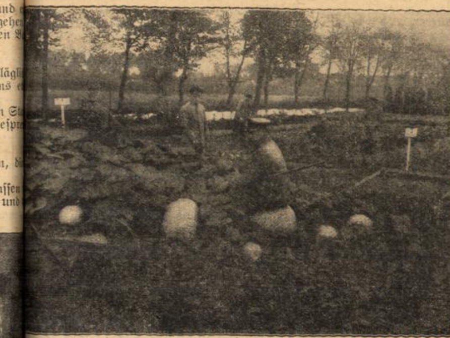
Ein ebenso zweckmäßig wie geschmackvoll angelegter Gemüsegarten der Kantine einer Etappen-Sanitäts-Abteilung.

Sanft, ganz sanft, mit geschlossenen Lippen hatte sie ihn auf den Mund geküßt. Sie waren jetzt bei der Bank angekommen, in deren Nähe ein breiter Weg vorbeiführte. Mit einem jähen Ruck setzte er sie auf den Boden, löste etwas gewaltsam ihre verengerten Arme und sagte schnell, mit feurigem Atem: „Du wirst mir doch etwas zu danken haben. Ich werde dir den Wagen schenken.“