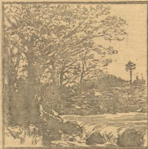
Wo ist die Asbest?

Diesen mannigfaltigen Gestaltungen und Eigenschaften entsprechend, wechseln auch die Benennungen, die der Asbest im Volksmunde führt. In Deutschland bezeich- net man ihn als Stein- oder Bergschlacke, als Bergleder, Bergholz und Ahrenstein. Er findet sich in Sachsen, Schlefien und Tirol. Die Franzosen, die ihn in der Dauphiné besitzen, nennen ihn pierre oston = Baum- wollenstein. In den berühmtesten und reichsten Asbestminen, denen zu Queved (Nordamerika), die 85 Proz. der gesamten Ausbeute liefern, heißt er Kanadafaser. Von Farbe ist er weißlich oder bräunlich.