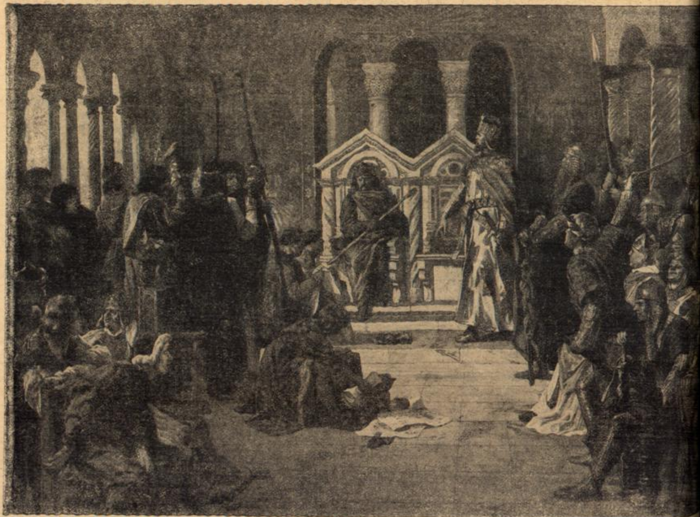
Der deutsche Kaiser Heinrich III. fordert König Heinrich I. von Frankreich zum Zweikampf. (Mit Text.)

„Nein, nein... ich kann dich doch nicht allein lassen dem nassen, verletzten Fuß. — Du bist ja ganz hilflos und hilflos. — Abgesehen, laß mich einmal sehen!“