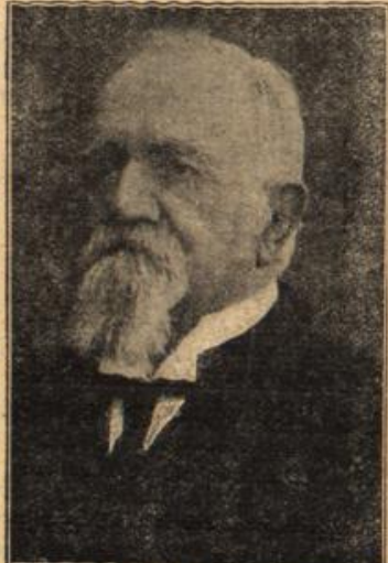
Titu Maiorescu, ehemaliger rumänischer Ministerpräsident. (Mit Text.)

Hoffentlich kommt Ihr nun bald zurück. Es tut mir leid, und ich bin erstaunt, daß sich Papas Zustand verschlechtert hat. — Was meint denn der Sanitätsrat? Soll ich an ihn schreiben? Abgesehen — Nauheim ist stets sehr anstrengend, die Wirkung kommt meist erst nach. Angstige Dich nur nicht! Wir werden unseren lieben Papa hoffentlich noch recht lange in unserer Mitte behalten; er soll sich noch lange an unserem Glücke erfreuen. Hat es das Geschick aber anders bestimmt — bei mir wirst Du Trost und Hilfe finden. Ich will versuchen, den Platz in Deinem Herzen auszufüllen, den er so lange eingenommen.