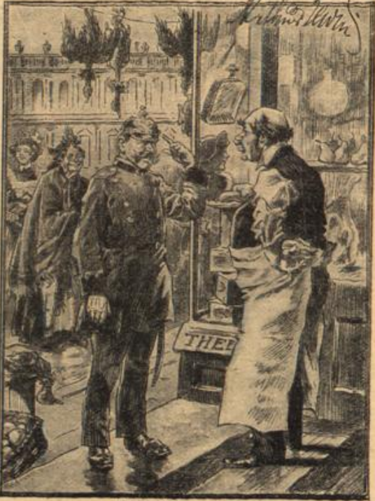
Bedingte Erlaubnis. Schumann: „Sie dürfen Ihre Waren nicht vor der Ladentür aufhängen!“ Kaufmann: „Dann werde ich aber nichts verkaufen und kann zulezt mich selbst aufhängen!“ Schupmann: „Reinetwegen, aber nicht vor der Ladentür!“

man den Essig noch einmal auf mit Ingwer und Nelken warm über den Kürbis. Dann wird der Kürbis in Töpfen oder auf einem Blech, welche mit Pergamentpapier zugebunden, aufbewahrt. — 2) Kürbis mit Mandeln verwenden. Am die Schale der Kerne leicht lösen zu können, genügt es, die Kerne vorher in heißes Wasser zu legen. — 3) Kürbisuppe. 1 Pfund Kürbis wird in Stücke geschnitten, in einem Liter Salzwasser weichgelocht, dann zerquillt, eine Messerspitze gehobener Ingwer, zwei Teelöffel Zucker und eine Messerspitze Jint daran getan. Die Suppe gibt eine Mahlzeit für drei Personen. M.