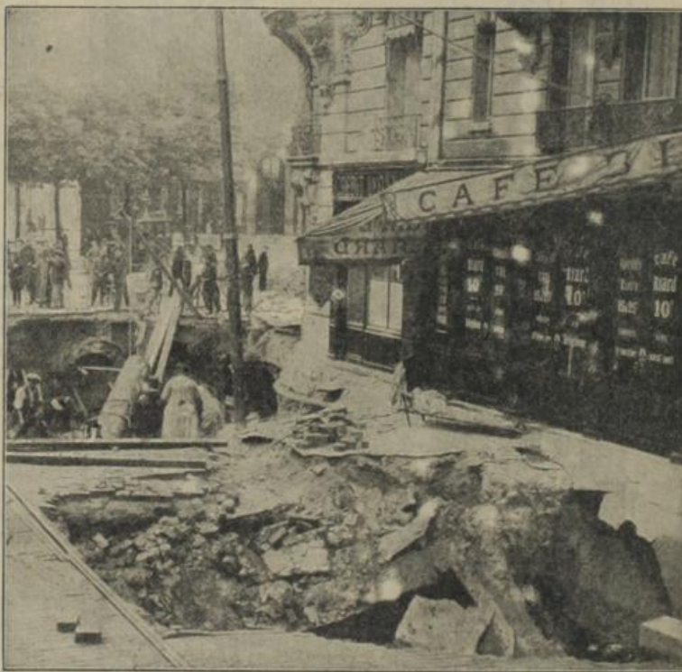
Die Anwerkerkatastrophe in Paris war so verheerend, daß infolge der Regengüsse und der Unterwässerung eine Straße geborsten ist, in der ein Auto versank.

ein paar Strahlen durch die blitzblanken Scheiben des Erkerfensters und sprühten tausend goldene Funken auf die schweren blonden Flechten. „Dornröschen!“ Erschreckt fuhr Maria bei dem Ton auf. „Guten Tag, liebes Bäschen! Schade, daß das Bild zerronnen ist! Ich sah seit vielen Jahren nicht so etwas Anheimelndes.“