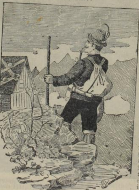
Wo ist der Bergsteiger?

Heringsgefallen. Ein Baumeister kam an seinem Bau vorbei und sah auf dem Gerüst einen Maurer stehen, der die Hände in den Taschen hatte und den Arbeitern zusah. Der Baumeister kletterte die Leiter herauf, klopfte dem Mann auf die Schulter und sagte: „Ich habe Sie jetzt 'ne Weile beobachtet; solche Leute wie Sie kann ich nicht brauchen, hier — da ist Ihr Lohn für