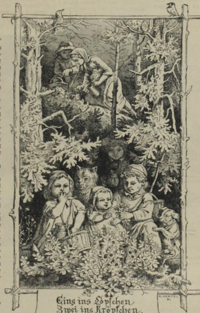
Ging ins Löpschen Zwei ins Kröpfchen.

„Du fülltest mein Herz überreichlich mit Sonnenschein, liebe Tante. Aber schränkst du dich auch durch Hergabe des großen Zimmers nicht zu sehr ein? Die Sachen konnten doch verpackt auf dem Boden stehen, und ich konnte dein Schlafzimmer mit dir teilen.“