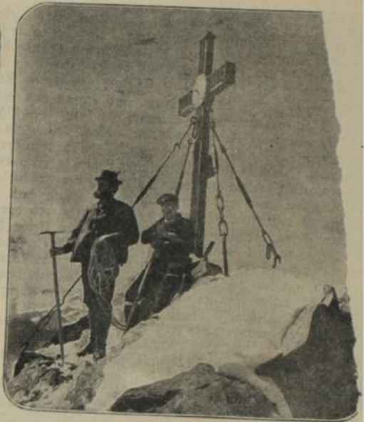
Der Grossglockner , auf dem ein großes Hotel errichtet werden soll und wegen dessen Abperrung zwischen Herrn Willers aus Bochum und der öster- reichischen Regierung ein interessanter Kampf ausgebrochen ist. Rechts: In 3800 Meter Höhe auf der Spitze des Grossglockners.