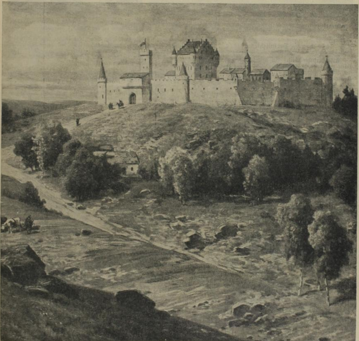
Das Stammschloß des Hauses Wittelsbach vor der Zerstörung. Kürzlich wurde in Althach (Oberbayern) in Gegenwart des bayerischen Königspaares die 600-Jahrfeier der Burg Wittelsbach festlich begangen. Die Burg wurde von Otto IV., Pfalzgrafen von Scheyern, in den Jahren 1113/1114 erbaut und durch Ludwig den Kelheimer, Pfalzgrafen von Wittelsbach, im Jahre 1209 zerstört.

Mit leuchtenden Augen sah Arel der schlanken Mädchengestalt in dem einfachen Trauerleide nach; die Mutter gewahrte es mit zitternder Freude. Jeder hing seinen Gedanken nach; die Stille wurde nur durch das gleichmäßige Plätschern der Wottlauwellen unterbrochen. (Fortsetzung folgt.)