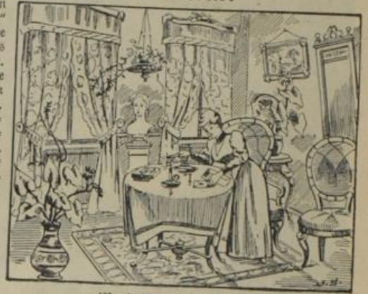
Wo bleibt denn Otilie?