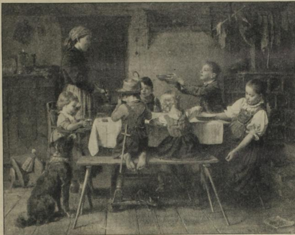
Nach dem Gemälde von S. Gautler.

„Bitte, Helmut, komm eben herein. Ich möchte dich einer lieben Bekannten vorstellen, und ich will dir hier