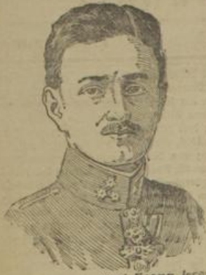
Erzherzog Karl Franz Josef

Durch den Tod Franz Ferdinands wird sein Neffe, Karl Franz Josef, der älteste Sohn des im Jahre 1906 verstorbenen Erzherzogs Otto, Erbe des Thrones. Der junge Erzherzog ist ein Großneffe des Kaisers und durch seine Mutter, Prinzessin Maria Josefa, ein Neffe des Königs von Sachsen. Er ist am 17. August 1887 geboren, steht also im Alter von 27 Jahren. Seit 3 Jahren ist er mit Rita, Prinzessin von Bourbon-Parma, verheiratet, und dieser Ehe ist bisher ein Kind, Franz Josef, geboren. Rita, die nun anderthalb Jahre alt ist, entsprossen. Am dem Erzherzog Thronfolger Karl Franz Josef Gelegenheit zu geben, den Dienst auf den hohen Kommando stellen kennen zu lernen, werden ihm ein militärischer Stab und