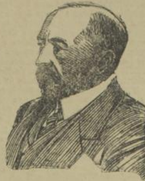
Exzellenz Dr. Behring

Daß dem lebhaften Prinzen eine förmliche Belagerung nicht so lieb war und so lag, wie ein frischer, fröhlicher Bewegungsfreudiger, ist nur zu sehr zu verstehen aber als preussischer Soldat und General führte er den Befehl seines Königs aus, so gut er wußte und konnte. Er selbst hat eingehende Rekonstruierungen vorgenommen, die in ihm die Ueberzeugung reifen ließen, daß das bevorstehende Stück Arbeit sein leichtes sein würde. Er selbst lag in voller Uebereinstimmung mit seinem Generalstabschef Mumenthal: „Düppel ist ein Stück Sebastopol, eine von Natur starke Stellung von der Art, daß sie in der Feldschlacht nur gegen von einem weit überlegenen Gegner angegriffen werden würde. Die Schanzen waren mit hundert Kanonen des schwersten Kalibers armiert und so angelegt, daß sie sich durch Artilleriefeuer und Geschützfeuer gegenständig flankierten und