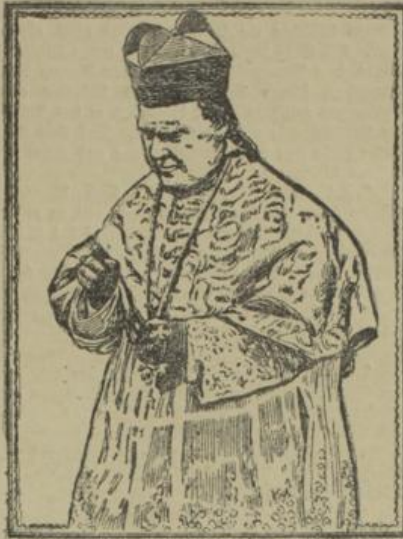
Kardinal-Bischof Dr. Kopp.

„Ach, lieber Gott, wenn man fast vierzig Jahre in der Kammer ist, und ansehen muß, wie eines so schwarzes Un-