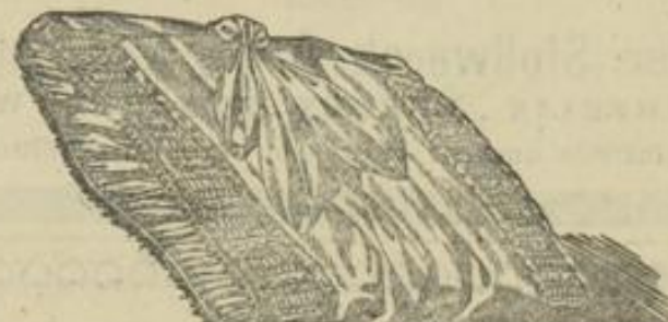
Abb. 9. Der fertige Muff.

in Rahmen von anderer Seite geplant, damit würde dann der schöne Gedanke, der der Schöpfung Grunde lag: jungen Mädchen, die zum Studium nach Berlin kommen, einen kameradschaftlichen Zusammenschluß und einen sicheren Schutz und Halt zu gewähren, feste, dauernde Gestalt gewinnen.