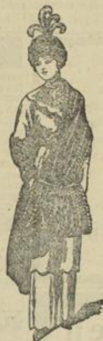
Abb. 1. Model mit Barett, Muff und Stola.