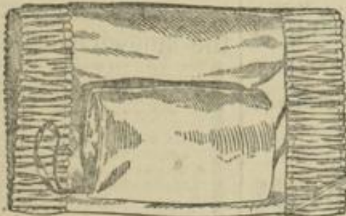
Abb. 7. Garnierte Innenseite des Muffes.