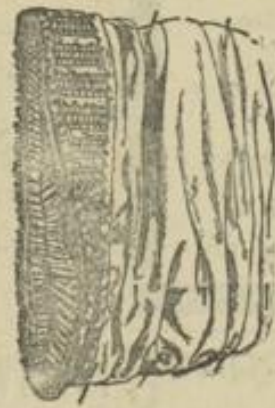
Abb. 8. Der Samt mit Garniturstreifen wird dem Muff aufgebracht.