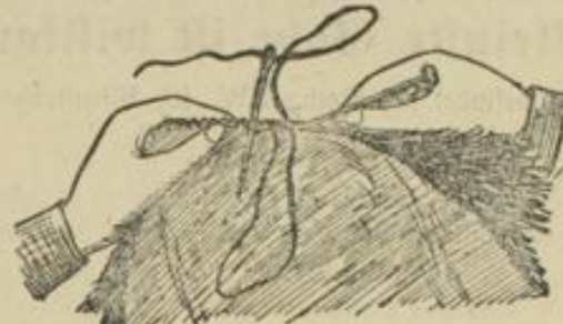
Abb. 3. Die Naht wird übermündlich zusammengeheftet.