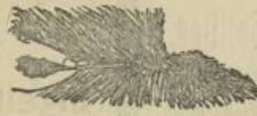
Abb. 4. Die Haare werden auf der Oberseite zwischen der Naht herausgezogen.