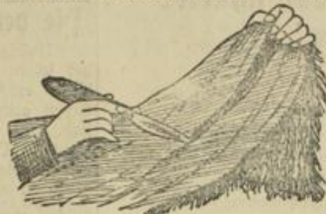
Abb. 2. Das Schneiden des Pelzes von der Rückseite.

Die an der Figur Abb. 1 gezeigte Stola wird auf ähnliche Weise bearbeitet wie die Muff, und auch das kleine, schicke Barett läßt sich selber aus Samt, Chiffon und Pelz anfertigen. Man kaufe dazu nur eine entsprechende Form aus Draht, der man das Material dann ausarbeitet, und dem Ganzen schließlich durch einen flotten Sederstich einen passenden Abschluß gibt, wie auch die unteren Ränder der Stola durch lange seidene Franzen einen hübschen Abschluß erhalten. S. 6.