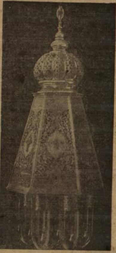
Silberne Lampe mit Goldmonogrammen, ein Geschenk unseres Kaisers für das Grabmal des Sultans Saladin.

Fled hob nur vieldeutend die Schultern, ließ sich den Daumen drücken, nicht verrathend, zu welchem Zweck, und verschwand.