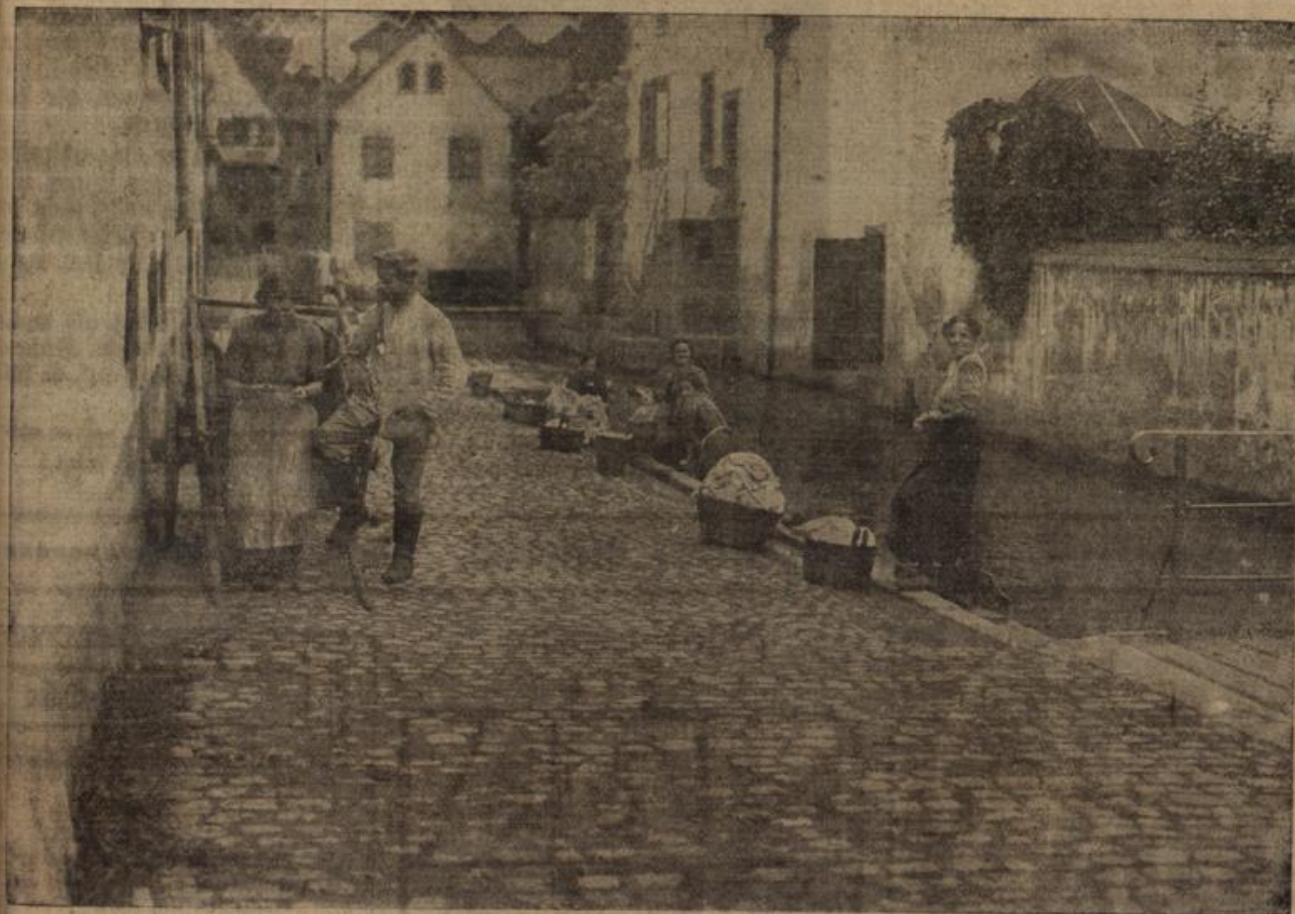
Stimmungsbild aus einem Vogesendorfe.