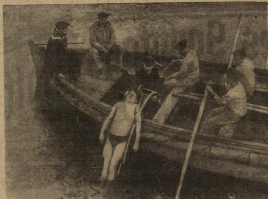
Eine neue Erfindung: Die Wasserrettungsleiter.

sehen? — Ich bin dann leichter zu täuschen — nicht?