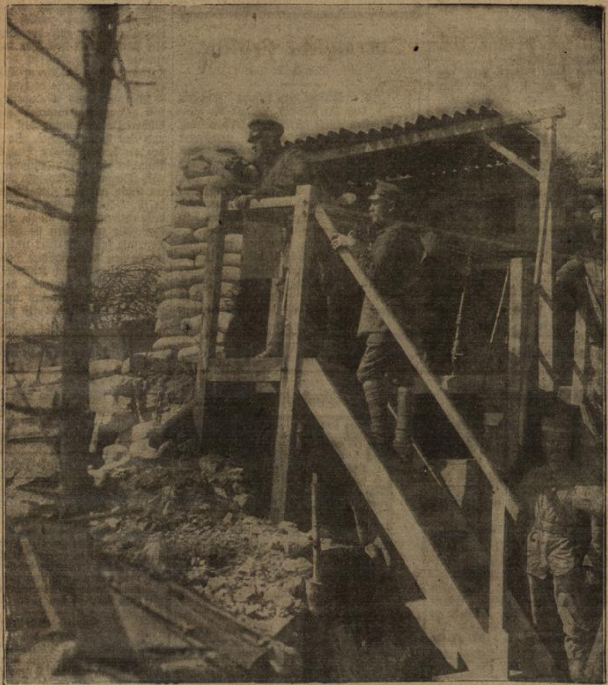
Auf Beobachtungsposten im Kampfgebiet des Westens. Verl. J. G. C.

finden können. Wozu denn das? Wozu denn — — ? Gut, daß man doch so 'nen Rest von Frömmheit hat.“ „Gled zog einen Strich durch die Luft. Man muß das lassen — es nützt nichts sich darüber Gedanken zu machen. Solche „Wozus“ und „Warums“ haben immer zu senen Geierbögen gehört, die man, wenn man klug ist, verjagt, aber nicht nisten läßt.“