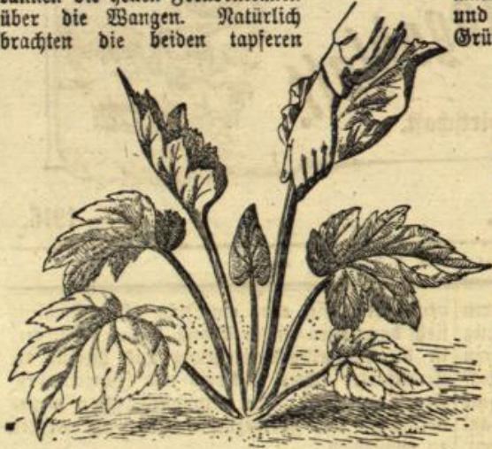
Abbildung 4. Frucht des Rhododendrons.

der Landsturmann Reichert, ist unerwartet aus dem Kampfe gegen die Franzmänner auf Urlaub gekommen. Raum hat die Begrüßung stattgefunden, da öffnet sich die Tür, und, siehe da, herein tritt der Enkel Reicherts, der Sohn seines Ältesten, gesund wie ein Fisch, der von der Schulbank als Kriegsfreiwilliger zum Kampfe gegen die Russen geeilt war. Seine Brust ziert das Eisene Kreuz, und er hat es bereits bis zum Offizier-Stellvertreter gebracht. Na, ich sage, war das eine Freude nach langer Trennung bitterem Schmerz! Dem alten Gevatter Reichert und noch mehr der braven Frau Gevatterin rannen die hellen Freudentränen über die Wangen. Natürlich brachten die beiden tapferen