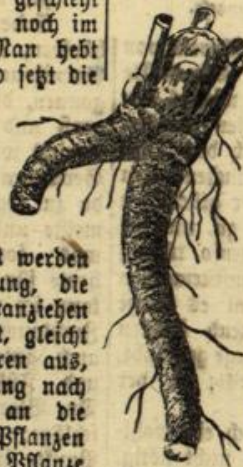
Abbildung 3. Einjährig. Rhabarber-Sämling.

Anbau aufmerksam zu machen und die neuesten Erfahrungen hinsichtlich des Anbaus auf dem Lande als beste Vermehrungsart erwiesen. Am sichersten die Sortenechtheit zu gewährleisten, wie wir sie z. B. in Frankfurt in bester Ware vorfinden. Doch ist die Vermehrung durch Sämmlingsvermehrung nicht aller Erfolg versprechend. In neuerer Zeit ist die Aussaat von Rhabarbersamen von Kaiser mit gutem Ergebnis betrieben und empfohlen worden. Der Rhabarberbau erfordert eine genügende Feuchtigkeit des Bodens, sei es im Gartenbeet oder im freien Felde. Hier ist tiefes Graben unbedingt geboten; im Garten empfiehlt sich die Anpflanzung auf 50—60 cm. In beiden Fällen ist das Land mit genügender Vorratsdüngung zu versehen. Thomasmehl und