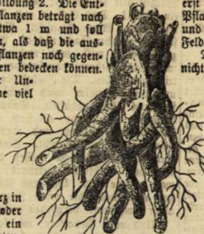
Abbildung 2. Ein zum Pflanzen fertiger Rhabarberstod.