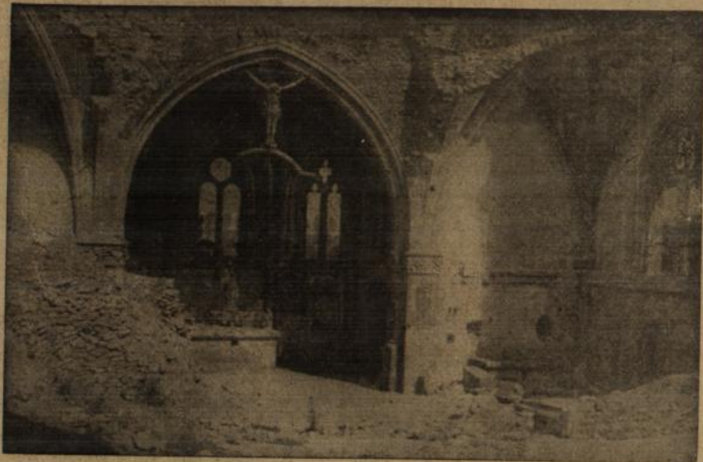
Durch französische Geschützfeuer zerstörte Kirche in Sermont.

Frau Marie schüttelte ihn froh bewegt am Arme. „Und das Schreiben ist notariell, hat Gret gesagt. So ein Glück! Anzweifeln könnt' man's ja sonst — — notariell ist's und aus Berlin — — und das Geld liegt schon parat. Edmund braucht bloß Ja und Amen dazu sagen.“