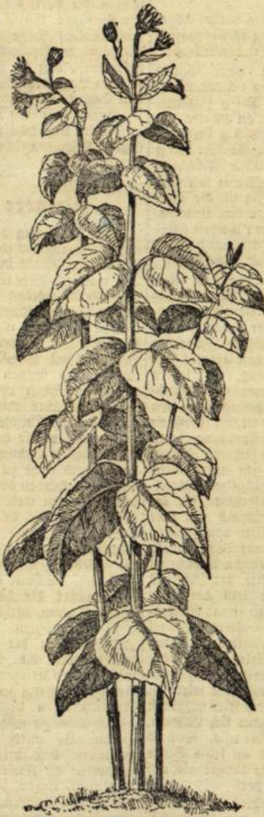
Abbildung 1. Topinamburpflanze.