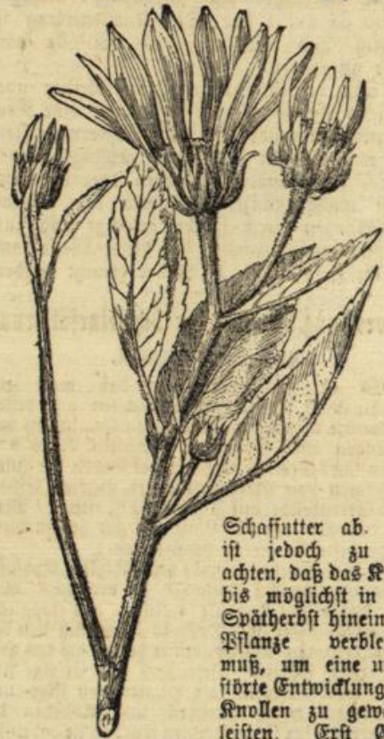
Abbildung 2. Blüte der Topinambur.

Das Kraut gibt sowohl im grünen wie im getrockneten Zustande ein ausgezeichnetes