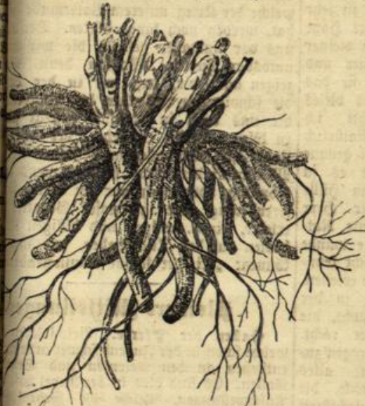
Abbildung 1. Älterer Rhabarber-Wurzelstock.

*) Alle unsere Leser machen wir darauf aufmerksam, daß die früher herausgegebenen, so ungemein beliebten Artikel