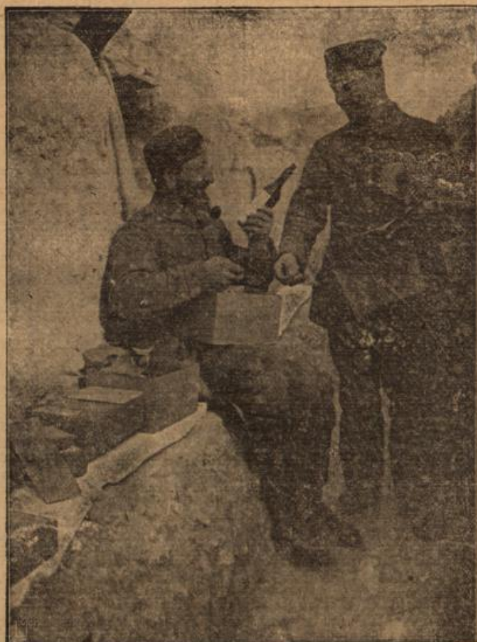
Gintressen und Auspacken von Liebesgabenpaketen im vordersten Schützengraben. Leipzig: Grosse-Blitz.

Barnes, Wohnliches gaben. Die Möbel, Sofa, Tisch und Stühle waren altmodisch, wohl von Dänemark importiert. Ueber dem Sofa hing ein verräuchertes Delbild,