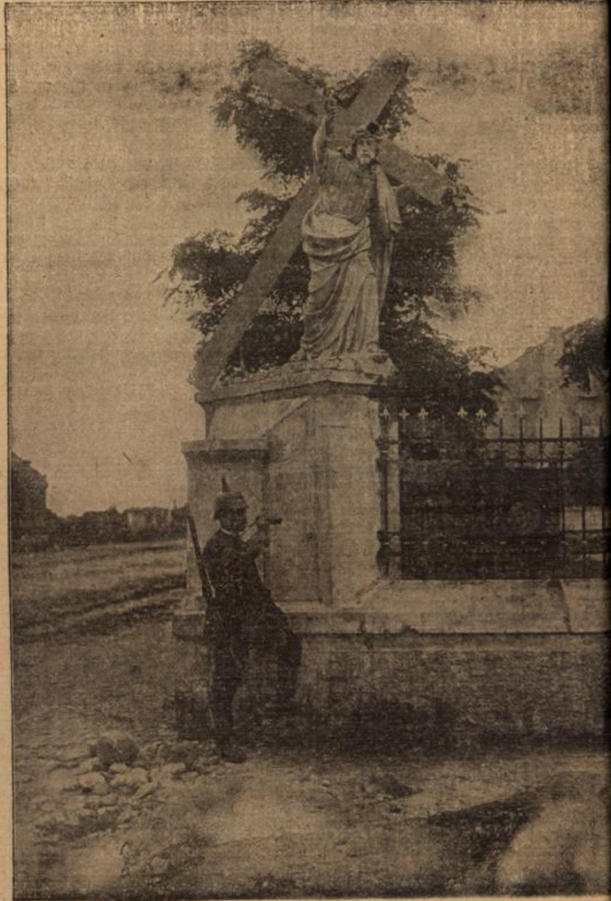
Von Granatkugeln getroffene Christusfigur am Friedhof zu Konstantinow bei Warschau. Davor deutscher Posten.

Kurz darauf brachte eine unserer trouillen einen jungen Burschen in