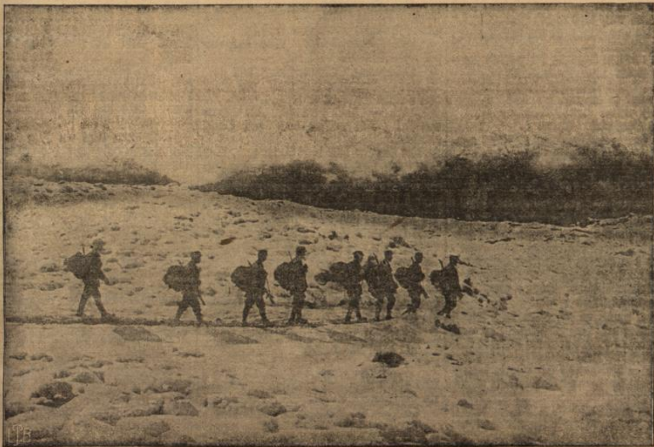
Osterr.-ungarische Patrouille im Neuschnee ein Hochplateau in den Dolomiten überschreitend.