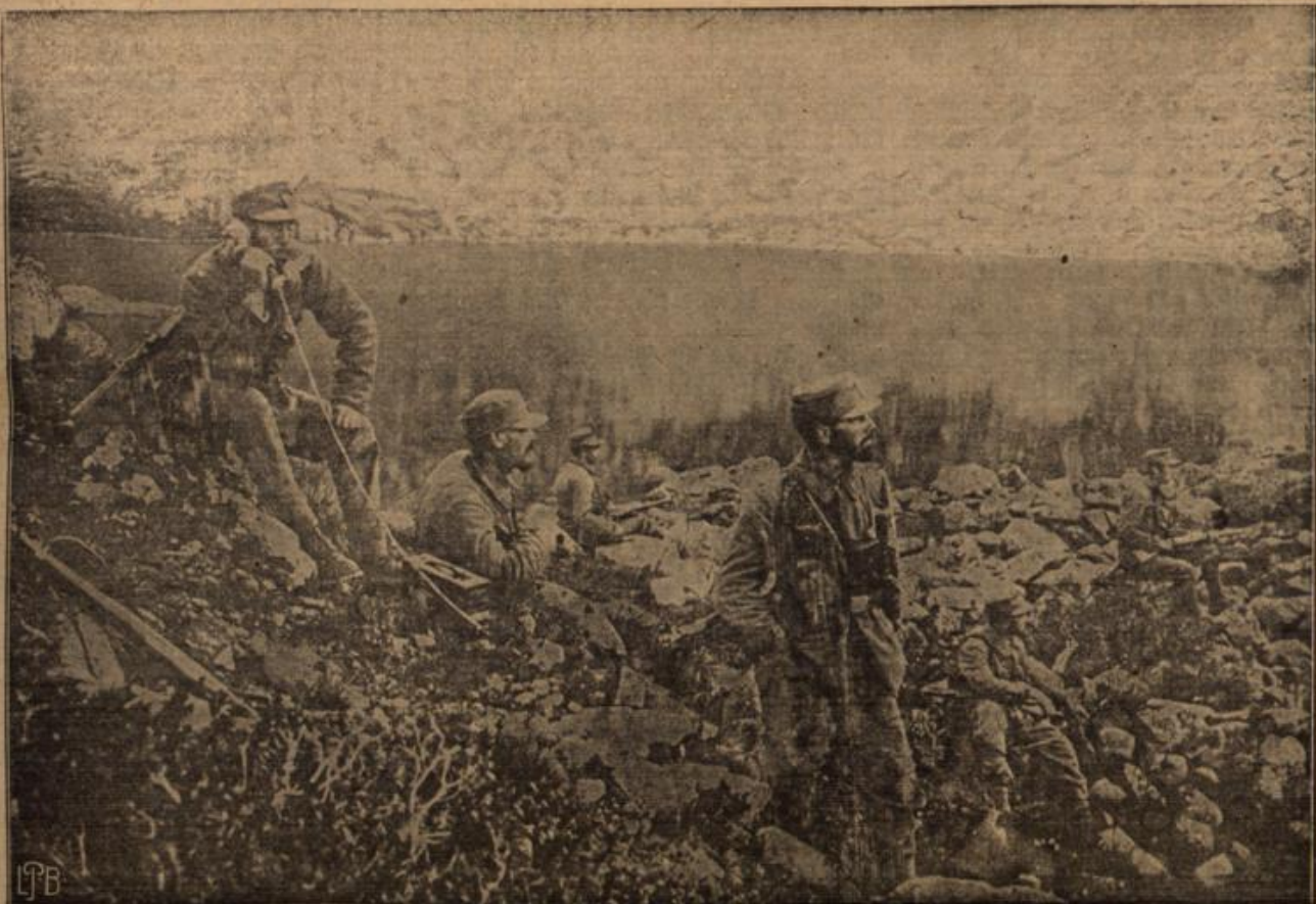
Vorgeschobene Telephonstelle an einem der zahlreichen kleinen Dolomitenseen.