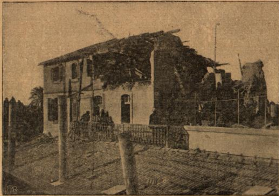
Das vom französischen Panzerkreuzer „Jeanne d'Arc“ beschossene Fabrikgebäude einer deutschen Firma in Jaffa (Palästina).

Unsere Feinde haben in ihrem Aerger über ihre Mißerfolge manchmal zu ganz eigenartigen Mitteln ihre Zuflucht genommen, um einmal den Hartenden dabei etwas ganz besonderes zu melden. So verschleppten die Russen friedliche Bewohner aus Ostpreußen und Galizien und berichteten von vielen Gefangenen, welche sie gemacht hatten, die Engländer meldeten aus den Kolonien große Siege — über die Zivilbevölkerung, und Frankreich, das nicht etwa zurückstehen wollte, konnte in Palästina einen schönen Erfolg buchen. In Jaffa beschoss nämlich der französische Panzerkreuzer „Jeanne d'Arc“ eine deutsche Fabrik, angeblich, weil sie für die türkische Militärbehörde arbeitete. Die Begründung traf zwar nicht zu, aber die französische Flottenkommandantur konnte doch nun einmal einen Sieg verzeichnen, damit diejenigen verstummen, die immer wieder fragen, ob die Verluste an den Dardanellen das einzige ist, was von Frankreichs stolzer Flotte zu melden ist. — Unser unteres Bild zeigt bulgarische schwere Artillerie bei einer Übung.