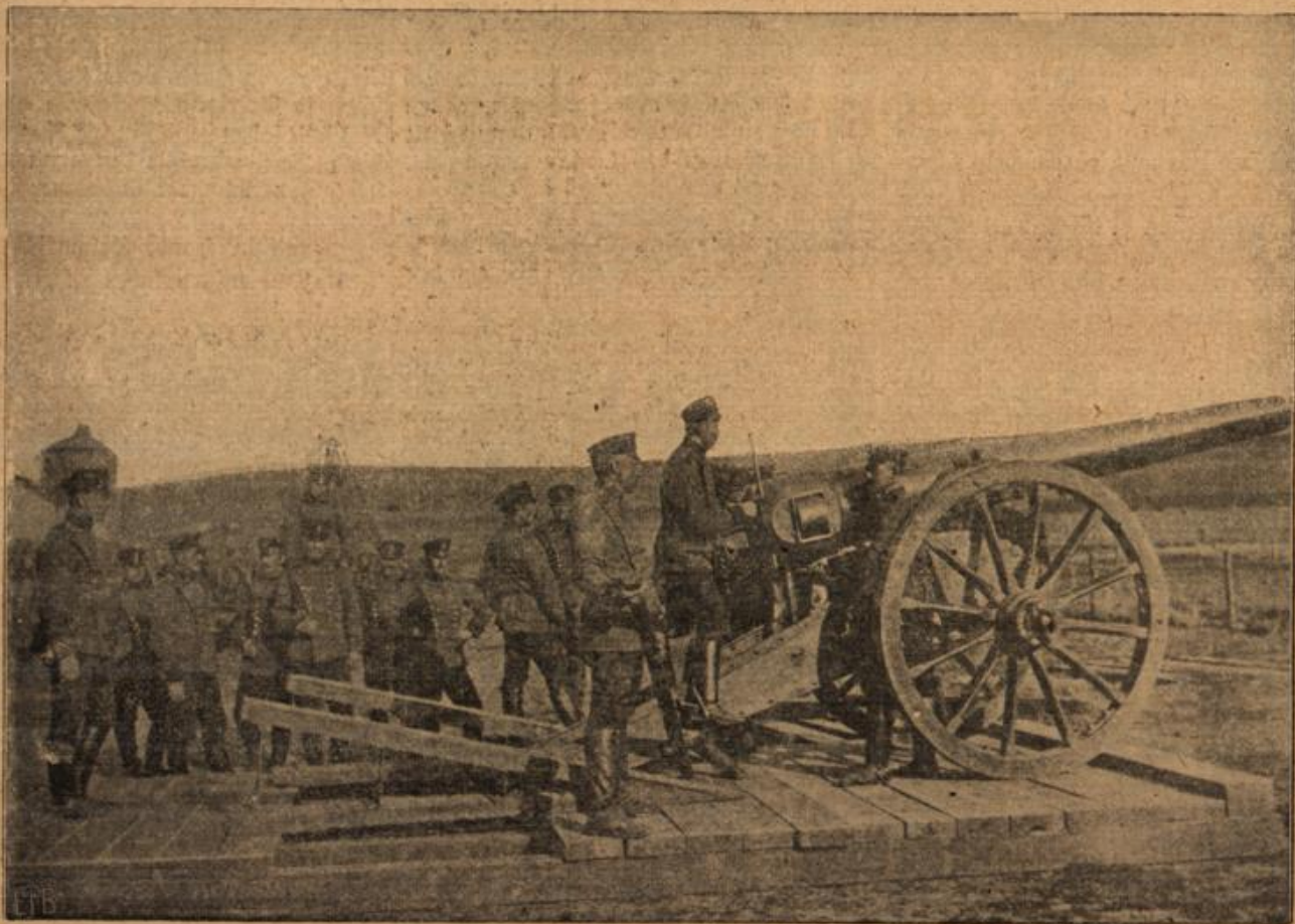
Bulgarische schwere Artillerie bei einer Übung.

Unsere Feinde haben in ihrem Aerger über ihre Mißerfolge manchmal zu ganz eigenartigen Mitteln ihre Zuflucht genommen, um einmal den Hartenden dabei etwas ganz besonderes zu melden. So verschleppten die Russen friedliche Bewohner aus Ostpreußen und Galizien und berichteten von vielen Gefangenen, welche sie gemacht hatten, die Engländer meldeten aus den Kolonien große Siege — über die Zivilbevölkerung, und Frankreich, das nicht etwa zurückstehen wollte, konnte in Palästina einen schönen Erfolg buchen. In Jaffa beschoss nämlich der französische Panzerkreuzer „Jeanne d'Arc“ eine deutsche Fabrik, angeblich, weil sie für die türkische Militärbehörde arbeitete. Die Begründung traf zwar nicht zu, aber die französische Flottenkommandantur konnte doch nun einmal einen Sieg verzeichnen, damit diejenigen verstummen, die immer wieder fragen, ob die Verluste an den Dardanellen das einzige ist, was von Frankreichs stolzer Flotte zu melden ist. — Unser unteres Bild zeigt bulgarische schwere Artillerie bei einer Übung.