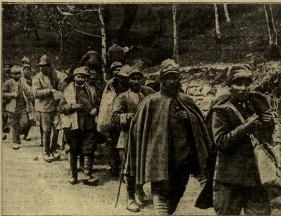
Vom italienischen Kriegsschauplatz: Italienische Gefangene aus den Piave-Kämpfen.

Und so kam es auch. Als Kurt Werner am nächsten Tag zu einer Stunde, wo er den Oberlandesgerichtsrat zu Hause wußte, erschien, wurde er abgewiesen. Ein zorniges Lächeln verzerrte sekundenlang seine Züge, als das Mädchen ihm die Karte wieder zurückbrachte, mit dem Bescheid, die Herrschaften seien weder heute noch sonst für ihn zu sprechen. Aber als sie die Tür wieder geschlossen, da hatte er die Faust geballt. Ein