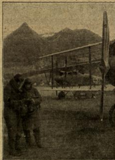
Eine Fliegerschule im Hochgebirge: Besprechung der Flugzeugbesatzung vor der Abfahrt.