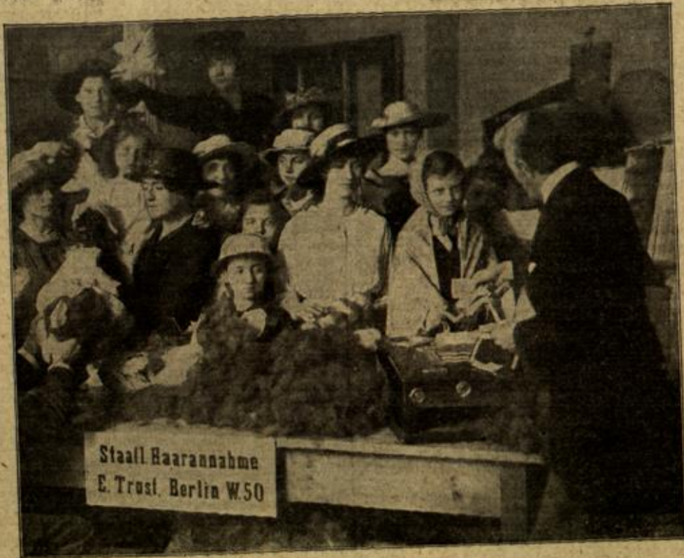
Die Frauenhaarsammlung in Berlin: Ablieferung von Frauenhaar in der amtlichen, von der Kriegsrohstoff-Abteilung des preuß. Kriegsministeriums eingerichteten Sammelstelle.

Hans zeigte ihn der Mutter. Gleich kam sie aus der Küche: „Ein wundervoller Satz, Tante Lotte,“ sagte sie. — „Jetzt einen Satz von dir, Mutter,“ bat Hans. — „Aber, Hans, ich mach' das Abendessen fertig, ich kann keine schönen Sätze lochen.“ — „Aber, Mutter, irgend-einen Satz wirft du doch —“ Da schlug die Mutter im Kochbuch nach: „Den vielleicht, Hans?“ Und folgsam schrieb der Hans in sein Konzeptheft: „Die durch den Krieg hervorgerufene Knappheit zwingt auch die kriegsfeindlichste Hausfrau zur Beschneidung der lukullischen Bedürfnisse ihrer Familie.“ Tante Lotte meinte zwar, der Satz sei ein wenig nächtern. „Bis auf 'lukul-lisch“,“ sagte Onkel Franz.