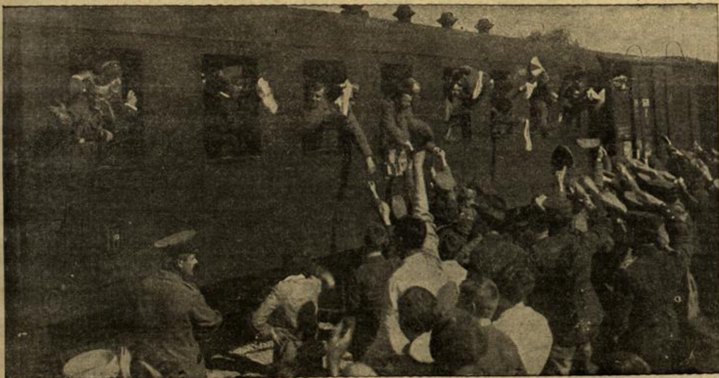
Gefangenenaustausch mit Frankreich: Deutsche Austauschgefangene aus Frankreich auf der Fahrt nach Konstanz.