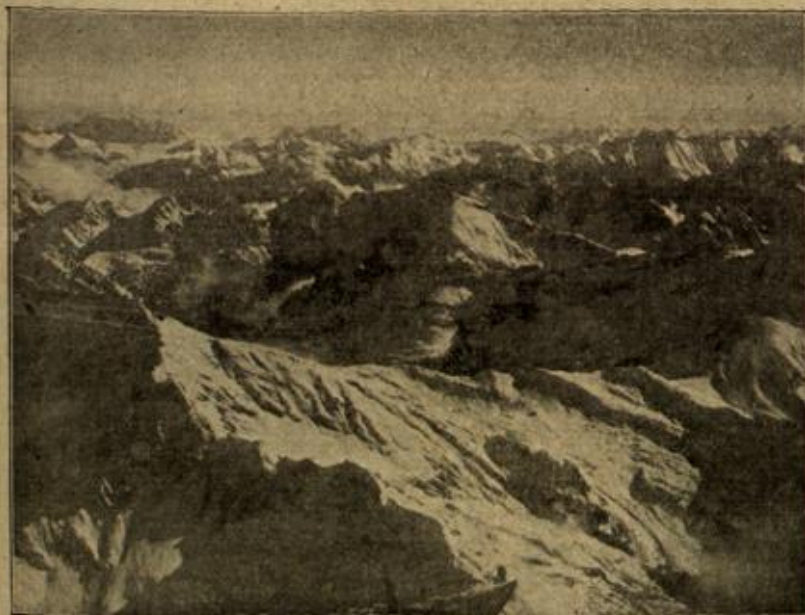
Vom deutschen Fliegerdienst: Aufnahmen bei einem Fluge über die bayerischen Alpen: Blick über das Nebelhorn nach der Zugspitze.