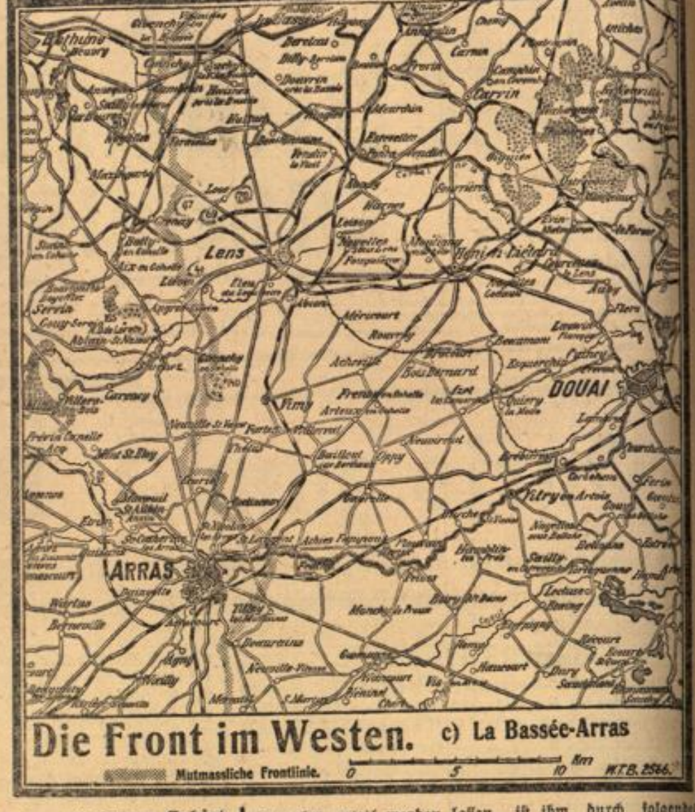
Die Front im Westen. c) La Bassée-Arras

lagten. Der Kapitän ließ sofort im Sid-Bad-Kurs fahren. Das Flugzeug verschwand schließlich und warf noch vier Bomben auf Schiffe, die vor Downs vor Anker lagen, ohne jedoch Schaden anzurichten.