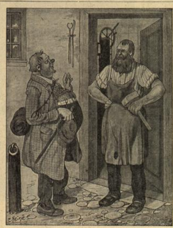
Beiseiden. Handwerksmeister (zum Handwerksburschen): „Arbeit kann ich Ihnen jetzt keine geben, ich habe gegenwärtig selbst wenig zu tun!“ Handwerksbursche: „Na, probieren Sie's doch, Meister; so wenig Arbeit kann's ja nicht geben, wie ich brauch'!“

Feldzeugmeister Potiorek , der die gegen Serbien und Montenegro operierenden österreichisch-ungarischen Streitkräfte kommandiert, war beim Ausbruch des Krieges Armeemajor in Serajewo; als Chef der Landesregierung von Bosnien und der Herzegowina standen ihm außerdem bedeutende militärische Machtbefugnisse zu. Oskar Potiorek ist am 20. November 1853 zu Bleiberg in Kärnten geboren und hat eine rasche und glänzende Karriere hinter sich. Aus der Geniewaffe hervorgegangen, wurde er bald in den Generalstab versetzt, wo er sich hervorragend bewährte. Eine Zeitlang war er auch Stellvertreter des Generalstabschefs.