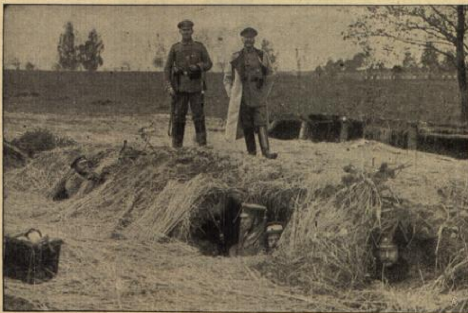
Groberte Erdhöhlen der sibirischen Truppen.