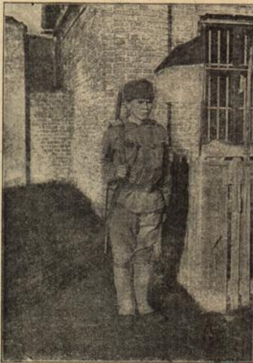
Ein junger polnischer Legionär auf Posten.

um in ein fernes, unbekanntes Land zu ziehen. Nach und nach ist Ulla sogar froh gewesen, daß der Bräutigam nicht alle Tage ins Haus kam. Sie hat schon oft gehört, daß sich in der Ferne die Liebe vertieft, heißer und fester wird. So war dies für beide Teile eine gute Prüfungszeit. Briefe flogen hinüber und herüber. Armin sandte die zärtlichsten Liebesbeweise, er konnte den Zeitpunkt kaum erwarten, da er sich die Geliebte holen durfte. Dieser rückt nun immer näher, noch wenige Monde trennten Ulla von dem wichtigen Schritt, den sie unternehmen wollte. Hat sie diesen auch nicht fieberhaft herbeigesehnt, so kam ihr der Brautstand doch unsagbar schön vor. Die Geschwister umgaben Ulla mit noch größerer Liebe und Sorgfalt, gleichsam als wollten sie der in kurzem aus dem Vaterhause scheidenden Schwester noch ganz besonders ihre große Liebe und Fürsorge beweisen. Die Freundinnen bewunderten und beneideten die junge, schöne Braut; daß sie ihren Ehestand im fernen Westen begann, war doppelt interessant. Die also gefeierte, bewunderte und auch beneidete Ulla Jansen saß hier, wenige Monate vor ihrer Hochzeit, und fühlte sich sehr unglücklich und mit der Welt zerfallen. Aus ihrem ruhigen, glücklichen Leben ist sie plötzlich herausgerissen worden.