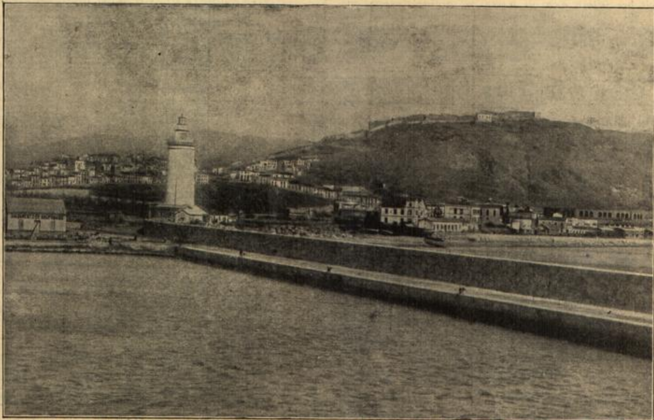
Die Einfahrt in die Dardanellen mit dem von einem englisch-französischen Geschwader bereits (aber erfolglos) beschossenen türkischen Fort Zeddil Bahr.

"Walbi, wie kamst du so von mir denken. Als ich Armin mein Versprechen gab, wußte ich noch nichts von Liebe, kannte auch nur wenige Herrn. Armin ist mir stets der vertrauteste Freund gewesen. Heute aber weiß ich, daß ich damals unrecht getan, nie dürfte er mein Jawort erhalten haben."