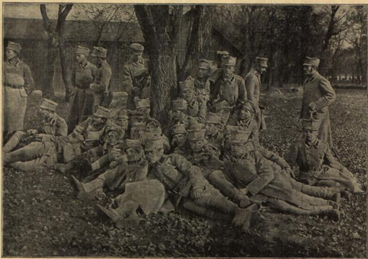
Vom galizischen Kriegsschauplatz: Polnische Legionäre in den Karpathen.