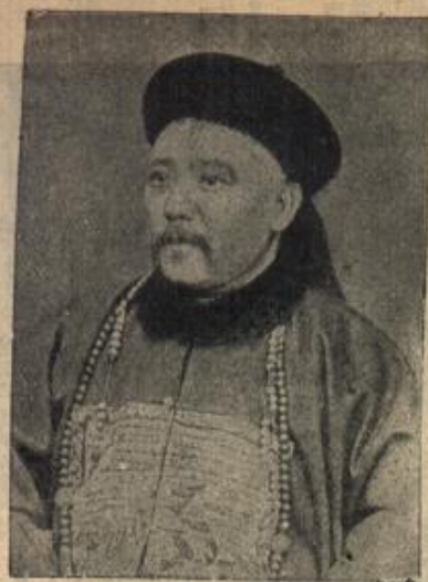
Yuan Shikai, Chinas hervorragendster Staatsmann, der im Jahr 1911 als Retter in der Not zur Niederwerfung der chine- sischen Revolution berufen wurde und dann die Präsidentschaft der Republik übernahm, hat jetzt die Kaiserwürde angenommen.