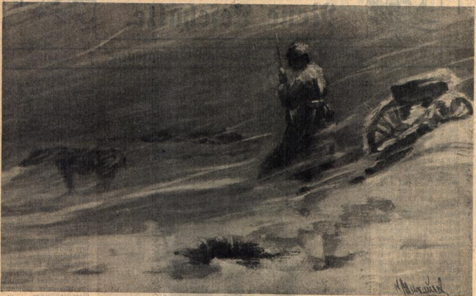
Posten im Schneesturm.

Ich zuckte die Achseln. "Herr Oberleutnant," sagte da Weber ganz gegen seine Art in warmem Ton, "wir werden heute noch in die Schlacht kommen. Vielleicht werde ich fallen. Und da drängt