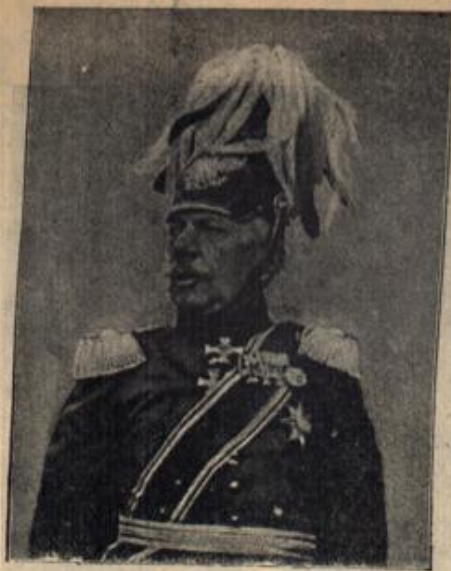
General Otto v. Emmich, der Eroberer von Lüttich, starb zwei Tage vor Weihnachten in seinem Heim in Hannover, wo er zur Erholung weilte.