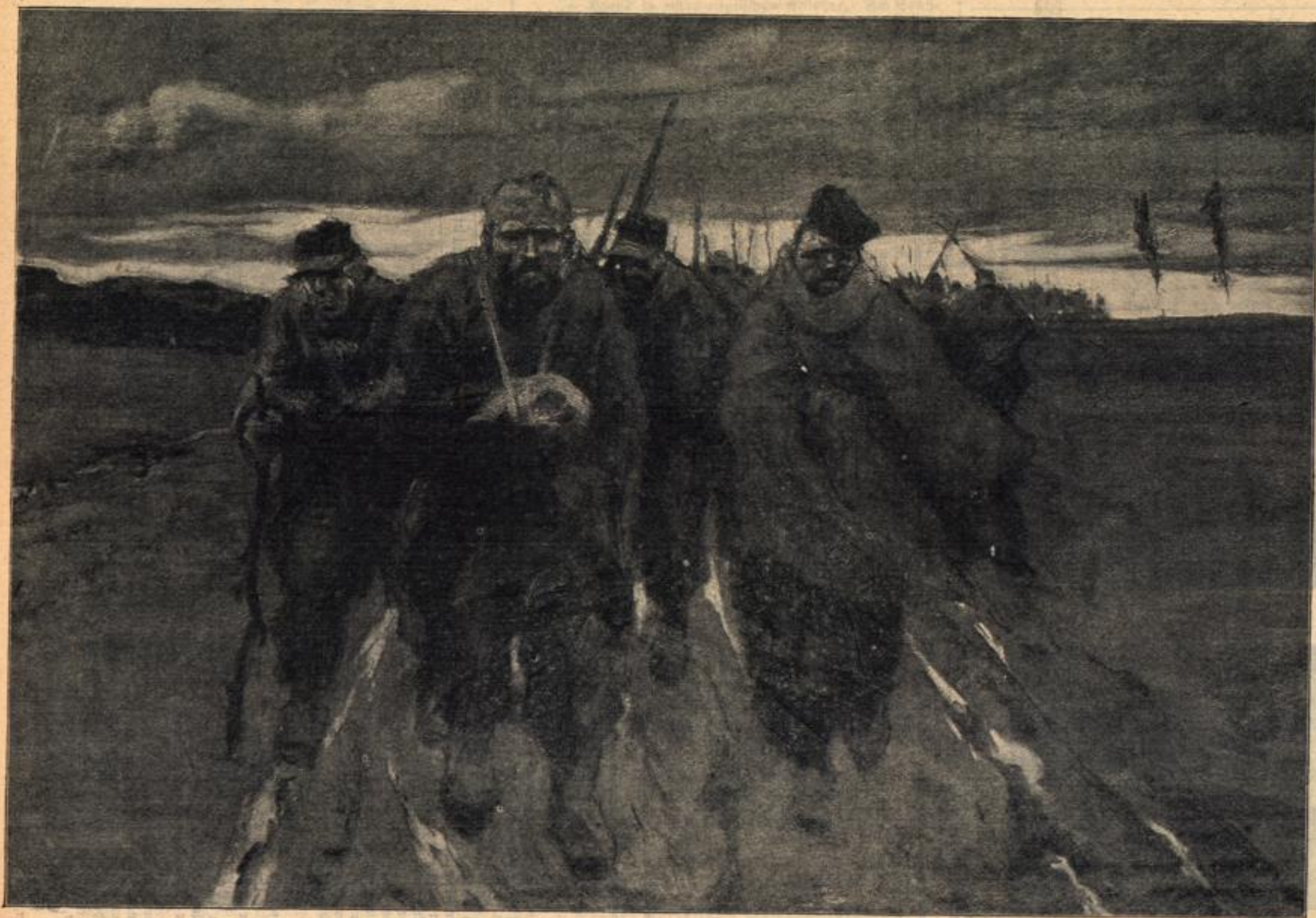
Der Rückzug der Alliierten in Mazedonien. Nach einer Originalzeichnung von Lub Ehrenberger. Nach der vernichtenden Niederlage im Bardartal durch die Bulgaren fliehen die Reste der verbündeten französischen und englischen Heere auf griechisches Gebiet.

den den Die gier Mor kulte Ital berg sehr sucht sach ling lang das tari lasse Mor ten, nung vertr den