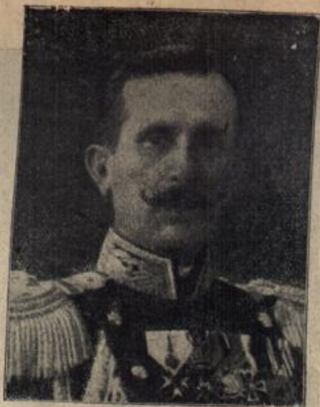
General Schellom, der Oberkommandierende der in Serbien ge- meinjam mit den Mittelmächten operierenden bulgarischen Armee.