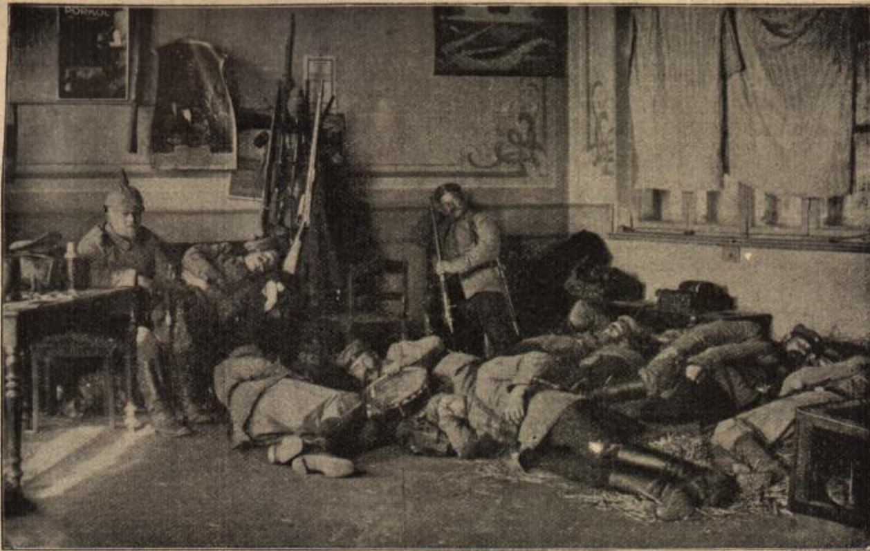
Aus den Tagen der Bedrohung Ostpreußens durch die Russen: Ein Stündchen wohlverdienter Ruhe unserer ostpreußischen Helden in einem Gasthof an der Grenze.