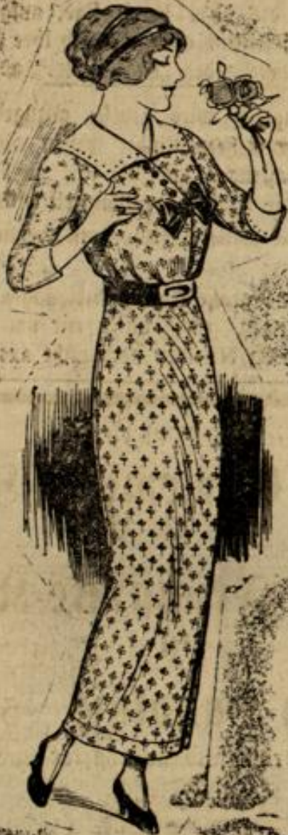
6538 Größe 42-44

Nr. 6669. Ein ganz einfaches, leicht herzustellendes Kleid mit geraden Linien veranschaulicht unsere Abbildung. Der glatten Bluse ist in der vorderen Mitte der mit Knöpfen und Knopflöchern ausgestattete Westenteil aus Unistoff unterzuarbeiten. Derselbe setzt sich auch am Rod fort und ist den drei Bahnen des gestreiften Rockes unterzusteppen. Die Knöpfe an diesen schmalen Bahnen können nur zur Garnierung angenäht werden, oder sie können zum Durchknöpfen eingerichtet werden. Aus einfarbigem Stoff mit einer Steiderei ausgestattet sind auch Manschetten und Kragen. Man braucht 1,50 m gestreiften Stoff in 1,20 m Breite, 1,25 m Unistoff in 80 cm Breite. Knöpfe.