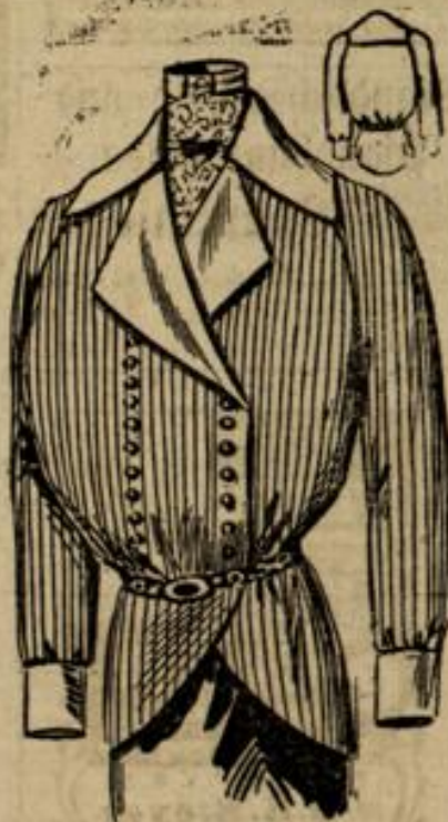
6779 Größe 44-46 Bluse in Kollensärm und gestreiftem Stoff.

Schnittmuster zu allen Modellen erhältlich.