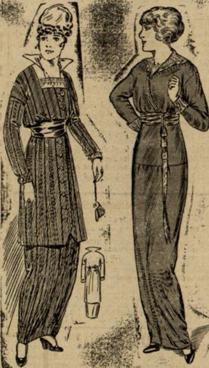
7354 Größe 44 Geschmackvolles Kleid mit Doppelrod.

Nr. 6538. Rasch und leicht herzustellen ist das schicke Tenniskleid aus weißem Leinen oder geblümtem Washstoff. Zum Matrosenträger, Schleiße und Manschette, die den eingesetzten Ärmel am unteren Rand begrenzt, wurde hellblaues Leinen verwendet. Man braucht 6 m Stoff in 80 cm Breite, \frac{1}{2} m Stoff in 80 cm Breite.