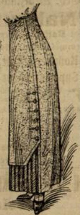
6570 Größe 42-44 Schöner Rod mit unternehmendem gestreiftem Teil

Nr. 6570. Der breiten, verkürzten Vorderbahn die scheinbar den Seitenbahnen aufknüpft, ist der wolantartige Teil aus gestreiftem Stoff unterzusteppen. Der Verschluß an dem dreiteiligen, hochgeschnittenen Rod ist in der hinteren Mitte einzurichten. Man braucht 2\frac{1}{2} m Stoff in 1,20 m Breite, \frac{1}{2} m gestreiften Stoff in 1,10 m Breite.