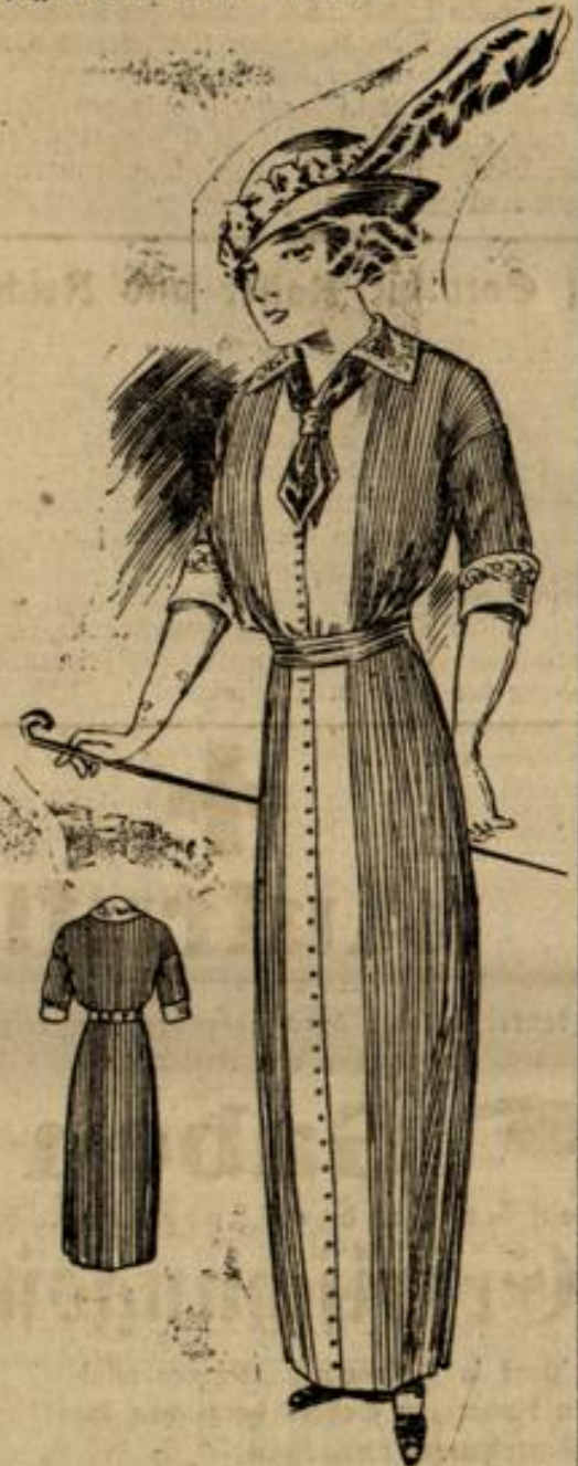
6669 Größe 42-44

Nr. 6735. Einer hinten schließenden Hüftpasse sind die zwei verkürzten, eingereichten Bahnen unterzusteppen. Ein Spitzenragen, von einer Seidenblende umgeben, begrenzt den Halsausschnitt, der vorne schließende Bluse. Ganz neu ist der hohe Seidengürtel, an dem linksseitig drei Schlupfen in abgestufter Länge und einem langen Ende aufrollen werden. Man braucht 5 m Stoff 1,20 m breit, \frac{1}{2} m Spitzenstoff 50 cm breit, \frac{1}{2} m Spitze 6 cm breit, \frac{1}{2} m Seide 50 cm breit, 1\frac{1}{2} m Samtband 4 cm breit.