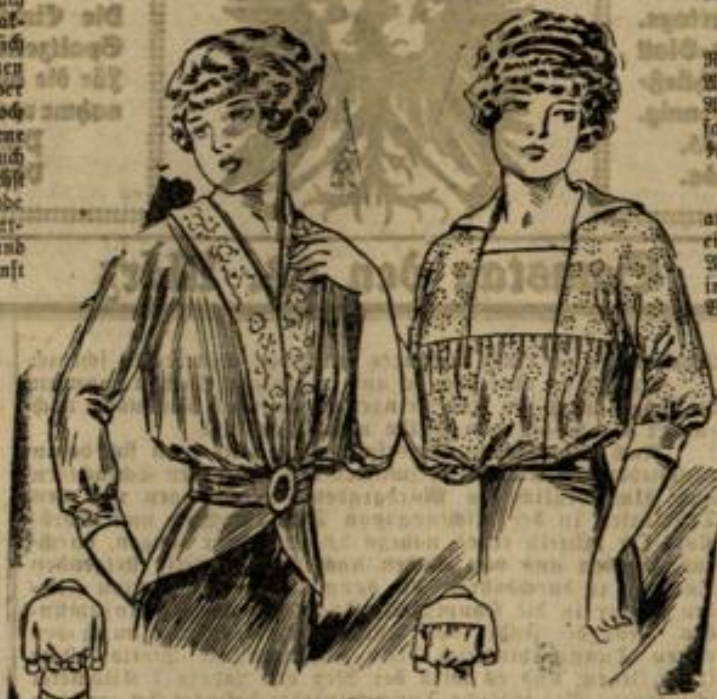
7030. Größe 42-44. 7031. Größe 44-46.

Nr. 6987. Die mit Vorderstülz gearbeitete Bluse zeigt auf dem Schalkragen, den Manschetten und dem runden Schoß eine bunte Seidenstickerei. Der gefaltete Seidengürtel, der den Ansatz des Schoßes deckt, schließt unter der großen Schleife in der hinteren Mitte. Man braucht: 2 m Seide in 110 cm Breite.