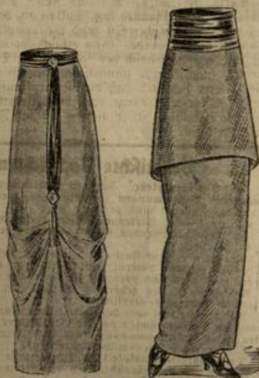
6769. Größe 42-44.

Nr. 6718. Sehr schick und leicht ist diese Bluse, zu der ein leichter Stoff das Material ergab. Vorder- und Rücken- teil werden der Paffe, welche sich auf dem Ärmel ausläßt, eingereicht untergesteppelt. Auch der lange Ärmel wird, unten eingehalten, in eine Manschette gefügt. Diefelbe sowie der Umlegkragen und die Paffe können mit einer einfachen Stickerei verziert werden. Schluß in der vorderen Mitte. Man braucht: 2 1/2 m Stoff in 80 cm Breite.