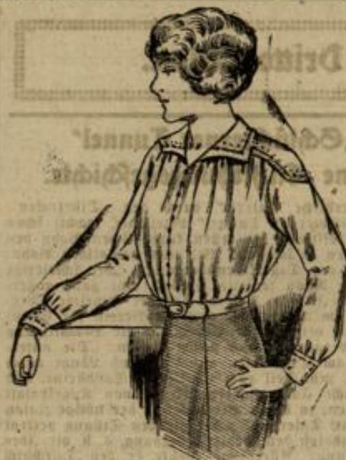
6987. Größe 42-44-46.