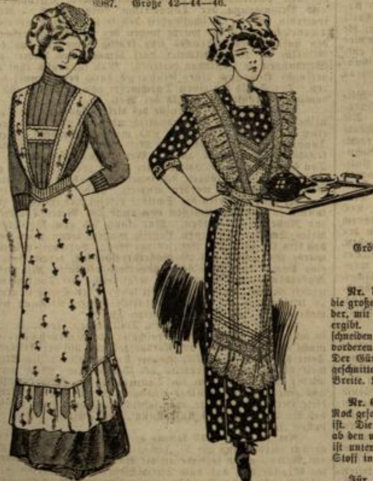
6919. Größe 42-44-46-48.

Für Nr. 6046 braucht man: 1/2 m Batist in 100 cm Breite, 3 m Stickereistoff in 4 cm Breite, 5 m Stickerei- spitze in 4 cm Breite.