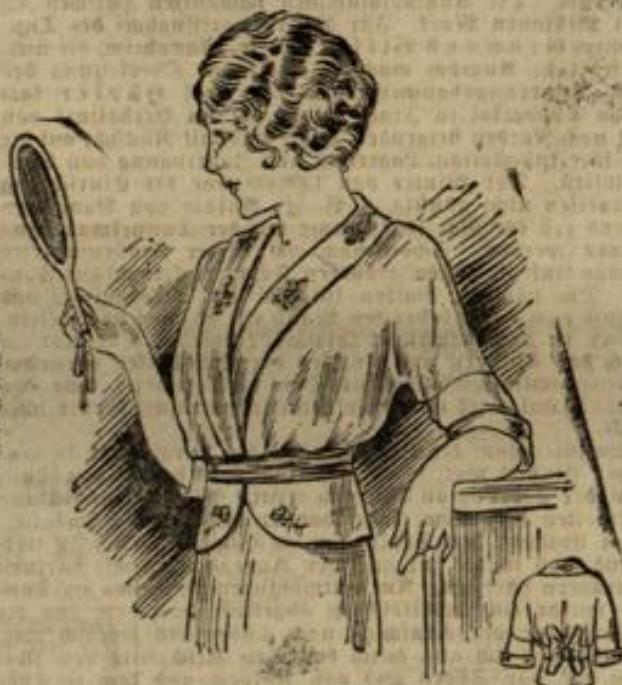
6987. Größe 42-44-46.

Nr. 6985. Der glatten, mit Rückenschluß versehenen Kimonobluse aus Wollstoff oder Seide wird im Taillenschluß ein in Falten geordneter Schoß angelegt. Eine leichte, mit schwarzem Verloarn angeführte Stickerei schmückt passgenau die Bluse am Halsausschnitt und fatter die Manschette aus. Ein schwarzer Ledergürtel umspannt den Taillenschluß. Man braucht: 1 1/2 m Stoff in 120 cm Breite, Verloarn.