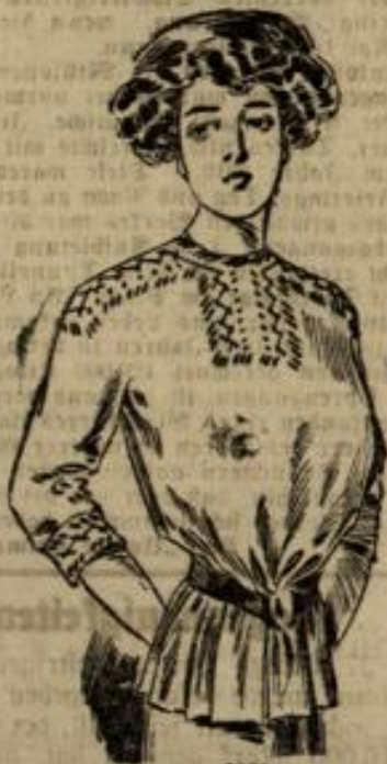
6985. Größe 42-44-46.

Nr. 6985. Der glatten, mit Rückenschluß versehenen Kimonobluse aus Wollstoff oder Seide wird im Taillenschluß ein in Falten geordneter Schoß angelegt. Eine leichte, mit schwarzem Verloarn angeführte Stickerei schmückt passgenau die Bluse am Halsausschnitt und fatter die Manschette aus. Ein schwarzer Ledergürtel umspannt den Taillenschluß. Man braucht: 1 1/2 m Stoff in 120 cm Breite, Verloarn.