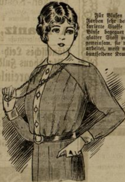
6992 Größe 44-46

Für Blusen sind neben der schwarzen wieder grelle Farben sehr beliebt. Vielfach werden gestreifte und karierte Stoffe bevorzugt, aber auch der unifarbenen Bluse begegnet man oft. Ob nun gemusterte oder glatter Stoff verarbeitet wurde, ein in den Blusen gemeinsam, sie werden alle einfach und recht lose gearbeitet, meist mit Rimons- oder Raglanärmel. Eine buntseidene Krawatte oder Gürtel, der noch rückwärts