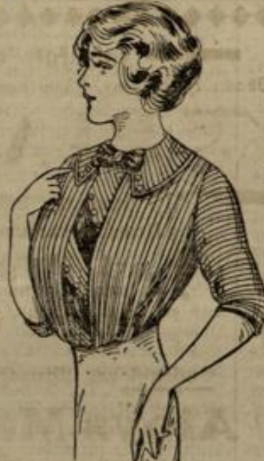
6998 Größe 44-46

Material: ca. 1 1/2 m Stoff 110 cm breit.