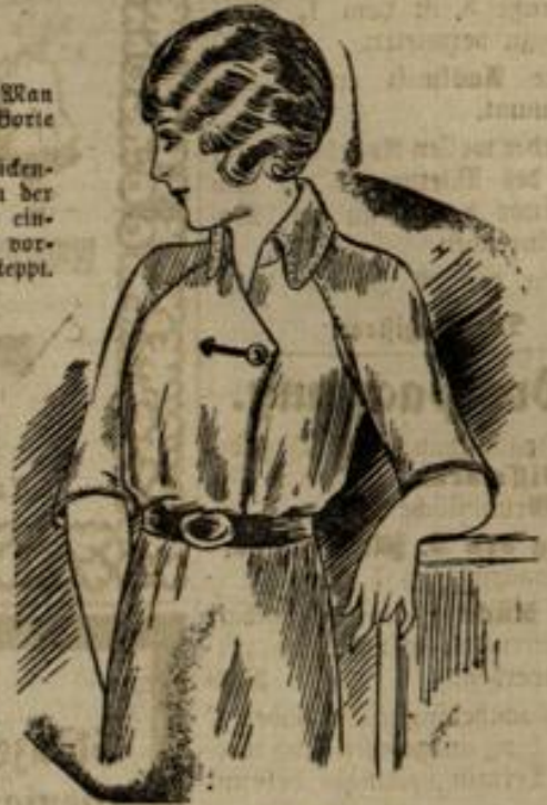
6975 Größe 42-44

Nr. 6975. Die schlichte Form der Bluse kann für Seiden- und Wolstoffe, auch für Samt verarbeitet werden. Ein absteigender Seidenpaspel begrenzt die übereinandergelegten vorderen Ränder, an denen ein mit gestüfter Flügel abschließendes eingelegerter Knopfloch neben Seidenknopf den Schlüsselmarkieren. Die Ärmel sind vorn raglanartig aufgesteppt, dem Rücken ange schnitten und an den unteren Rändern gepaspelt. Umgelegt, tragen sie Steppverzierung.