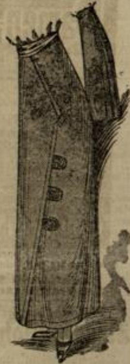
6560 Größe 42-44

Nr. 6560. Aus Cheviot oder aus Tuch kann dieser dreiteilige Rod gefertigt werden, an dem die vordere Naht unter Hüfthöhe einen gestreckten Winkel bildet. Bis zum Winkel ist die linke Bahn der rechten aufzustepfen, von da ab wird die rechte Bahn der linken aufgeschleppt. Die hintere Bahn ist in zwei Quastfalten zu ordnen. Man braucht: 3 m Cheviot in 1,20 m Breite.