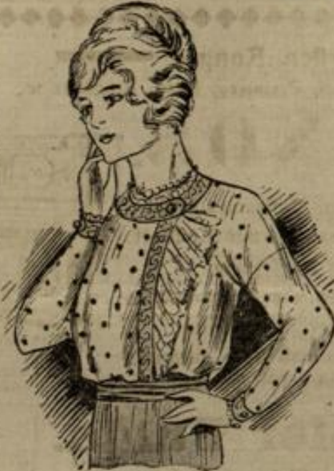
6989 Größe 42-44

Nr. 6989. Eine bunte, zum Blusenstoff passende Vorsteckerei umschließt den Halsanschnitt und schließt das rechte Vorderstück ab. Hier wird auch der unsichtbare Verschluss eingerichtet. Der dem Unterarm flach anliegende Ärmel wird