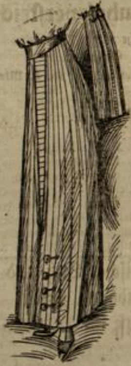
6565 Größe 42-44

Nr. 6565. Dem dreibahnigen Rod ist an der vorderen Naht ein quergestreifter Hohlknopf zwischenzulegen. Eine schmale, quergestreifte Blende schmückt auch die Hinterbahn in der Mitte. Man braucht: 2 1/2 m Stoff in 1,20 m Breite, Knöpfe.