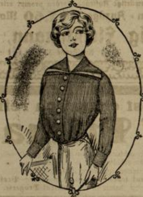
7022 Größe 44-46

als Schleife ausläuft, statten die Bluse vorteilhaft aus. An Stelle des Pelzbesatzes werden schmale Tastrüschen in absteigenden Farben oder in weiß verwendet. Mit Abb. 6992 bringen wir eine solche Bluse mit Raglanärmel, der mittels eingelegerter dünner Schürze der in Falten geordneten Bluse aufzustepfen ist. Umgelegt, bildet sie und Ranichetten bestehen aus weichem Stoff. Man berechnet: 2 m modischer Größe 1,20 m breit, 1/2 m weicher Größe.