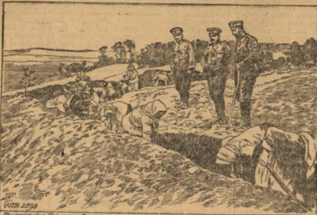
Russische Bauernfrauen werden zum Ausheben von Schützengräbern verwendet.