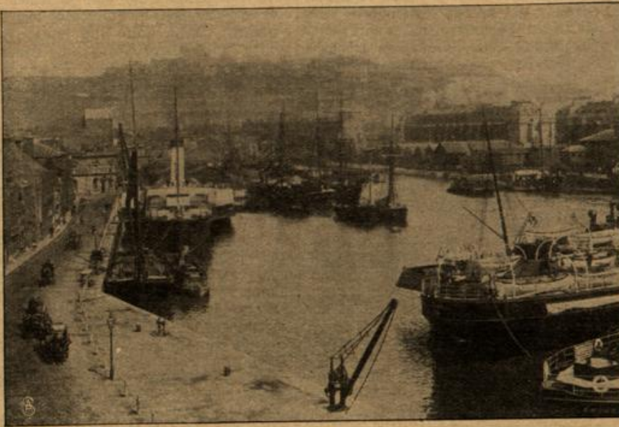
Bild auf den Hafen von Dover.