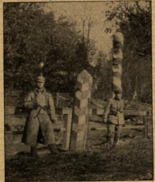
Deutscher Posten an der russischen Grenze bei Eydtkuhnen.

ten in und um Eydtkuhnen deutsche Truppen die Grenzschutz, nachdem der Ort lange Zeit heiß umstritten war. Von seinen vielen stattlichen Häusern und Gehöften (Eydtkuhnen zählte annähernd 4000 Einwohner) sind größtenteils nur ausgebrannte Räume übriggeblieben, ein paar kleine Häuschen ausgenommen, die versteckt zwischen dem Ufergebüsch jenes Grenzflächchens gelegen, dem Geschoßhagel und dem Flammenmeer entgingen. Gleich von Kriegsbeginn an haben dort harte Kämpfe stattgefunden, die sich dann mehrfach wiederholten und in deren Verlauf auch der dicht benachbarte russische Ort Ribarty in Trümmer gelegt wurde. Eydtkuhnen war übrigens bis zur Eröffnung der Ostbahn (1860) nur ein ganz nächiges Dörfchen, aus dem sich dann ein blühender Handelsplatz entwickelte.