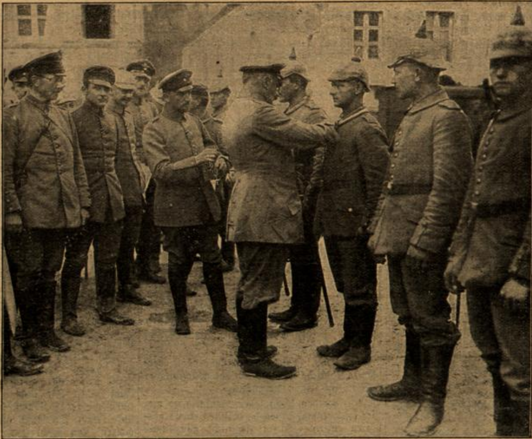
Nach dem Kampf: Dekorierung der Tapfersten eines Regiments mit dem Eisernen Kreuz durch den Oberst.