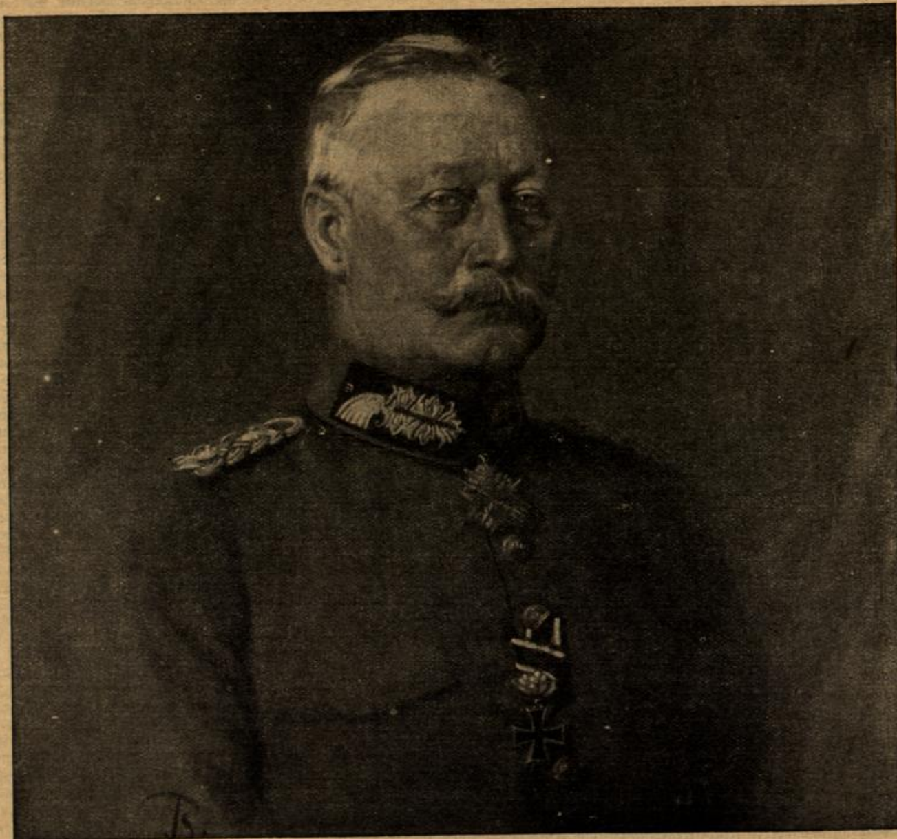
Exzellenz von Zwehl, königlich Preussischer General der Infanterie, der Eroberer von Maubeuge.