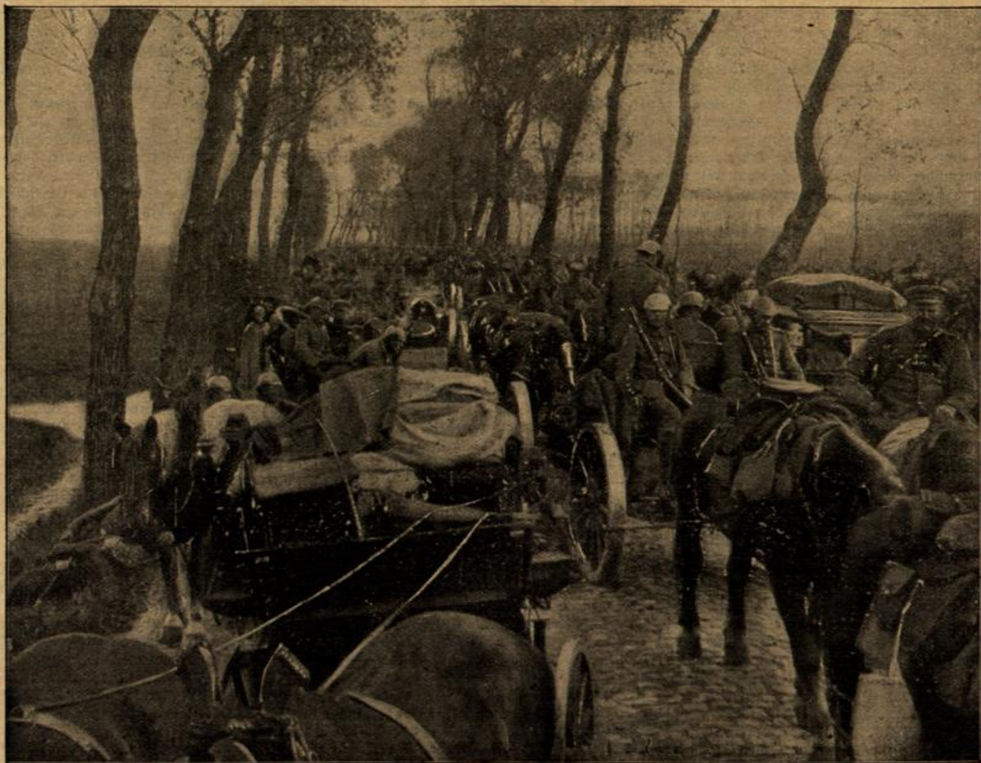
Mit unseren Truppen in Westflandern: Die riesigen zur Front ziehenden Truppenmengen auf den Landstraßen.