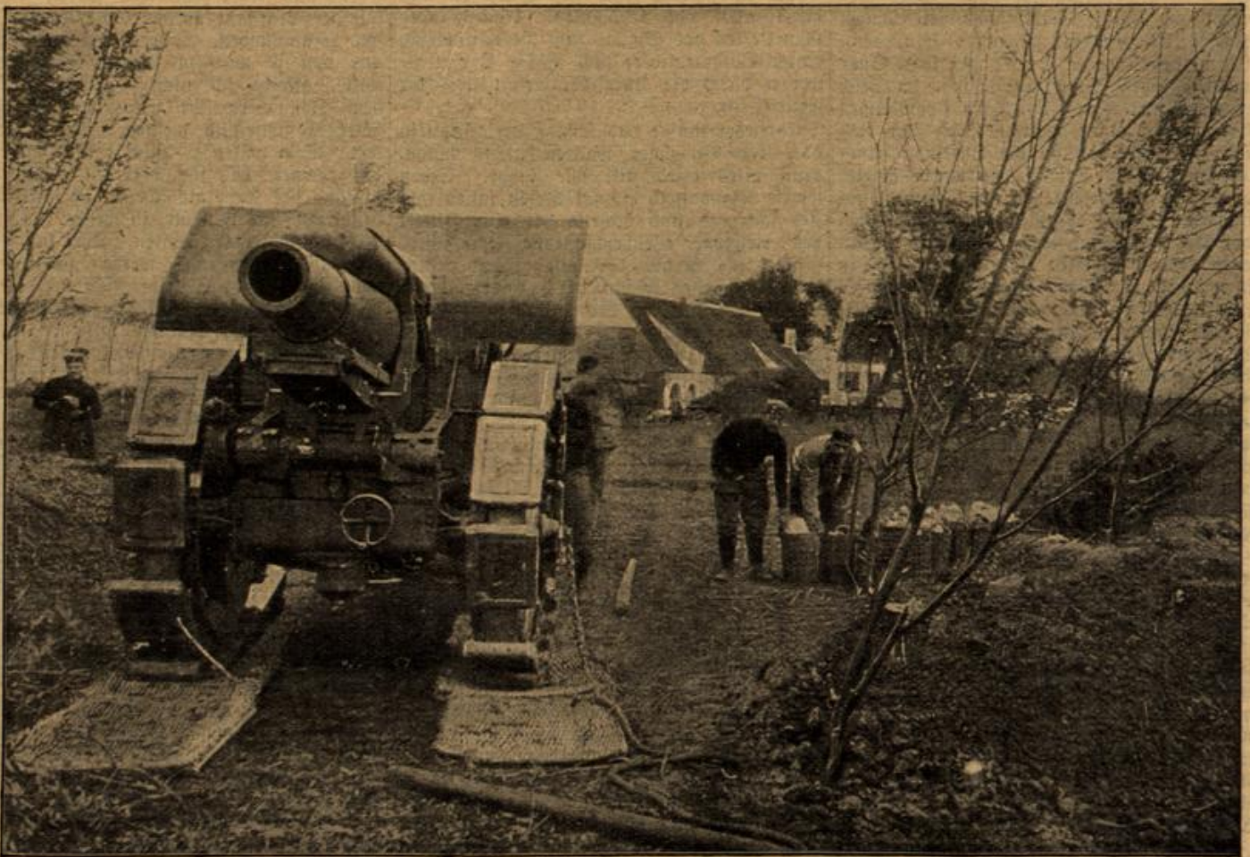
Flandrische Landschaft. Im Vordergrund einer der 21-cm-Mörser.