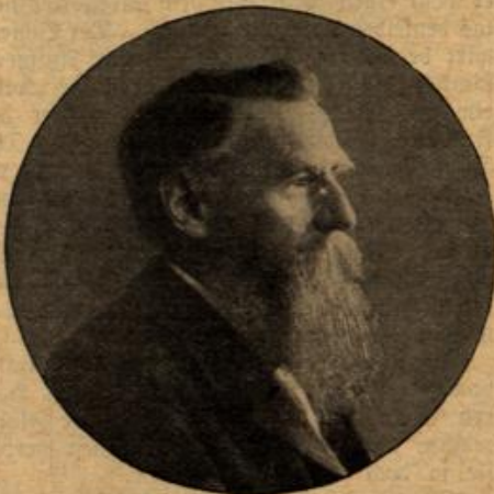
Professor Dr. W. Voigt, Physiker der Universität Göttingen, geht als Austauschprofessor an die Harvard-Universität in Massachusetts.

Einen imposanten Anblick gewährt das schwimmende Riesenhotel ohne Zweifel schon bei Tageslicht. Noch grandioser aber ist die Wirkung, wenn der stolze Riese zur Nachtzeit im vollen Lichterschmuck den Ozean durchfurcht und denjenigen, der überhaupt noch nie Gelegenheit hatte, einen Hochseedampfer zu sehen, wird diese Erscheinung anmuten wie ein Märchen aus tausend und eine Nacht.