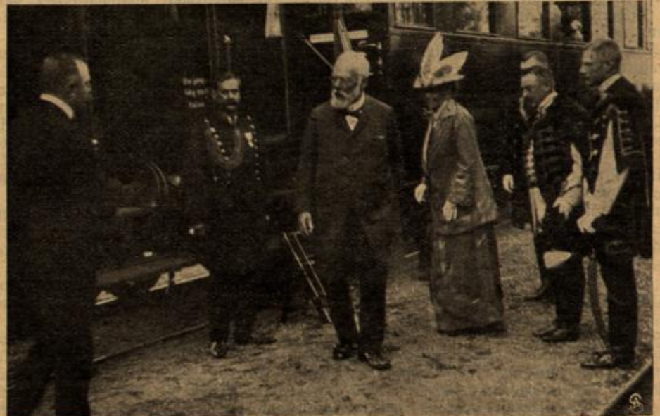
Ankunft des bayerischen Königspaares in Sarvar in Ungarn.