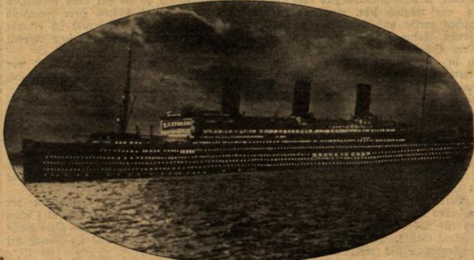
Der neue Riesendampfer „Vaterland“ der Hamburg-Amerika-Linie auf einer nächtlichen Fahrt in seiner vollen Beleuchtung.