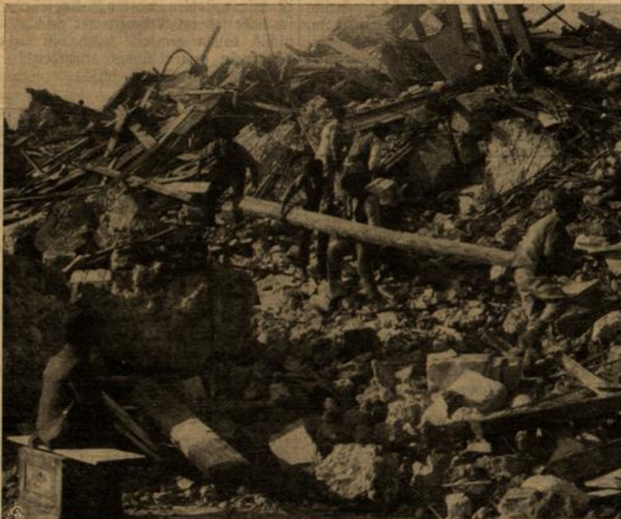
Zur Erdbeben-Katastrophe in Sizilien: Aufräumarbeiten in Mortara.