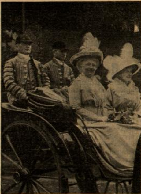
Das deutsche Kaiserpaar mit dem Herzog und der Herzogin auf der Fahrt zum Schloß.