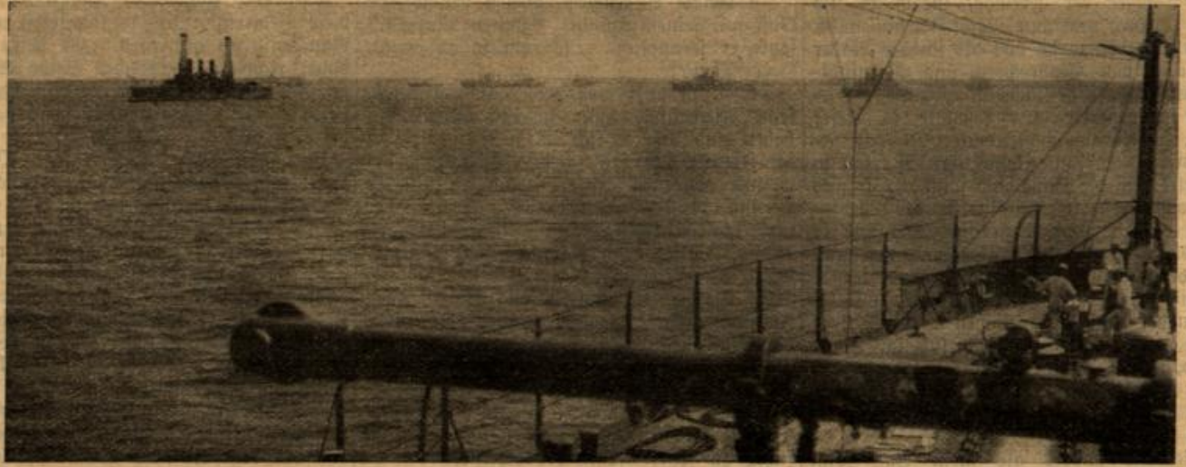
Vom Kriegsschauplatz in Mexiko: Die amerikanische Flotte vor Veracruz.