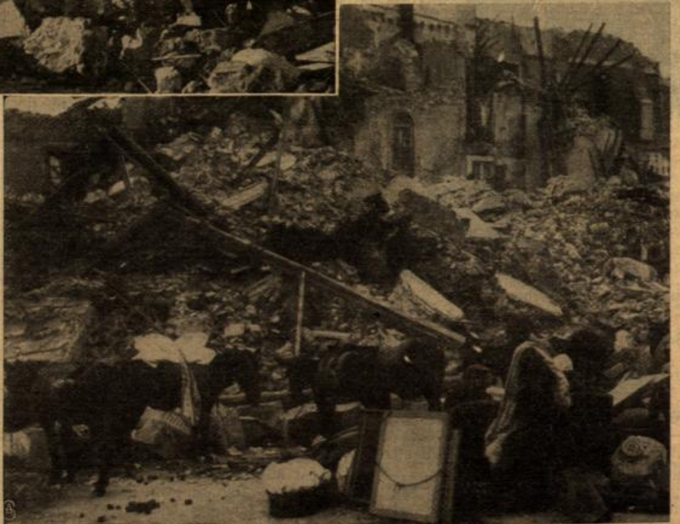
Zur Erdbebenkatastrophe in Sizilien: Geborgenes Mobiliar vor einem zerstörten Haus.

Mangano hat sich ein breiter, tiefer Erdsplatt gebildet; der Boden ist nicht zu erschöpfen, Schwefeldämpfe entsteigen dem Schacht. Ein furchtbarer Anblick war es, als Kirchtürme, Häuser und Höfe plötzlich wie von Riesen Händen geschüttelt erschienen. — Die Ursache des Erdbebens wird von dem bekannten Abbé Alfani, dem Direktor des Observatoriums in Florenz, auf vulkanische Vorgänge im Innern des Aetna zurückgeführt. Das Beben ist also tatsächlich durch größere Einstürze im Aetnatrater veranlaßt worden, durch die diese Distrikte schon so häufig schweren Schaden erlitten haben, so daß die Bevölkerung mit solchen Katastrophen schon fast rechnet. Wie Prof. Ricco mitteilt, sind die Vorbeben selbst von den feinsten seismographischen Apparaten nicht verzeichnet worden, dagegen hat das Hauptbeben den großen Seismographen und japanischen Pendel zerstört. Das Erdbeben wurde auf sämtlichen deutschen Erdbebenstationen durch die Apparate angezeigt.