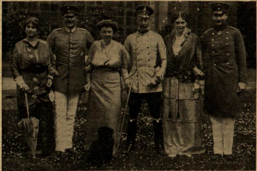
Eine lustige Gruppenaufnahme aus dem Braunschweiger Schloßgarten. Von links nach rechts: Prinzessin August Wilhelm, Prinz Eitel-Friedrich, Prinzessin Eitel-Friedrich, der Kronprinz, die Kronprinzessin, Prinz August Wilhelm.

Zum Tauffest in Braunschweig hatte die ganze Residenzstadt ein farbenprächtiges Feiertagsgewand angelegt. In den Straßen und namentlich auf dem weiten Plage vor dem Schloß drängte sich eine frohgestimmte Menschenmenge, um die Anfahrt der fürstlichen Gäste zu beobachten und dem Herzogs-paar lebhaft zuzujubeln. Ernst August, wie sein herzoglicher Vater und Großvater, heißt der junge Kaiserenkel, der am Samstag im ehrwürdigen Dom der Burg Dankwarderode feierlich getauft worden ist. Die Braunschweiger Bevölkerung nahm an dem festlichen Ereignis den freudigsten Anteil und bereitete dem jungen Herzogs-paar und seinen Gästen überall lebhaft