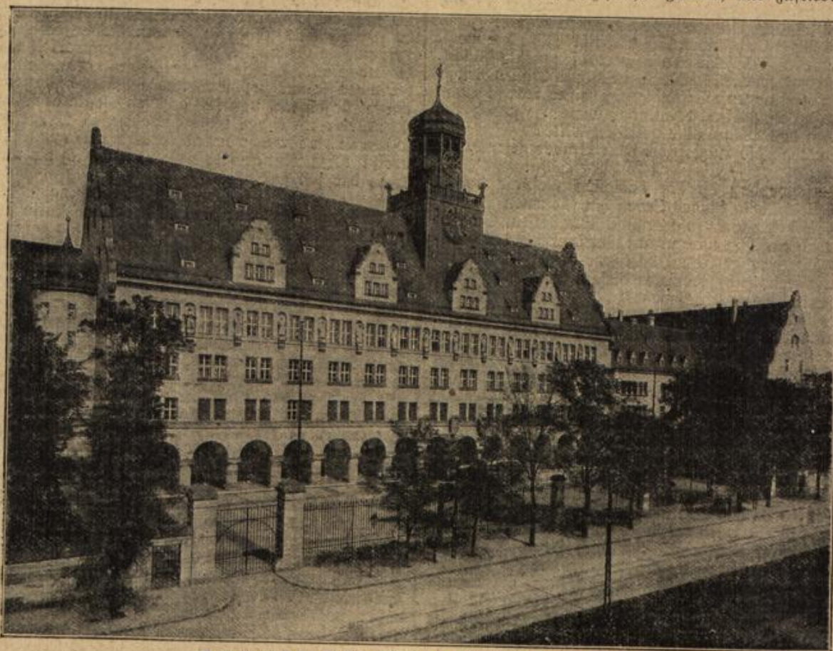
Das neue Zentraljustizgebäude in Nürnberg. (Mit Text.)

„Mit Vorsatz hab' ich ihn gemieden!“ entgegnete der Bruder.