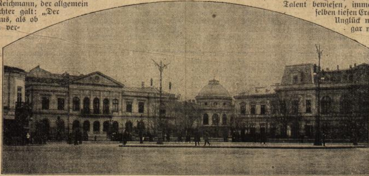
Das königliche Schloß in Bukarest, in dem der entscheidende Kronrat über den rumänischen Treubruch unter dem Vorsitz des Königs Ferdinand stattfand.

Ganz allmählich kehrten ihm Mut und Selbstvertrauen wieder. Wenn er nun den Eltern zeigen könnte, daß er doch nicht ganz schlecht war! Jauchzend hätte er sich in die Schlacht stürzen mögen, um mit seinem Herzblut seine tiefe Reue zu besiegeln. Aber es war, als wäre er gefeit. In den großen Kämpfen in Belgien war seine Batterie wiederholt stark mitgenommen