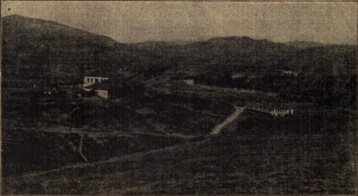
Das Strumatal südlich von Doiran, der Schauplatz der Kämpfe zwischen bulgarischen und serbischen Truppen.

Er zog die Uhr und rechnete nach? Eine ganze Weile konnte es noch dauern. Sein Herz schlug wie ein Hammer. Kam der feindliche Nachschub eher heran, so war er mit seinen Leuten verloren. Er biß die Zähne zusammen: Nur