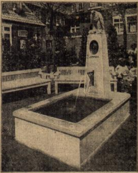
Der neue Emmichbrunnen in Hamburg.

Red forderte der junge Führer die Besetzung auf, sich zu ergeben. Die überraschten Feinde mußten annehmen, daß Jürgen einen größeren Truppenteil hinter sich habe. — Nachher, als sie sahen, daß sie sich hatten überlisten lassen, schossen sie wütende Blide auf Jürgen von Böhmer. Der besand sich in hoher Erregung, die von Minute zu Minute wuchs. Wenn nur die Patrouille von vorhin für schleunige Verstärkung sorgte!