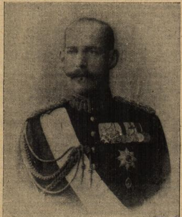
König Konstantin I. von Griechenland.