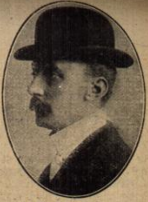
Graf Czernin, der bisherige österreichisch-ungarische Gesandte in Bulareh.