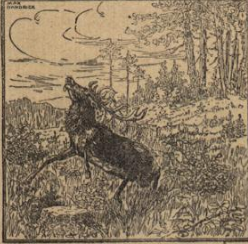
Wo ist der Jäger?