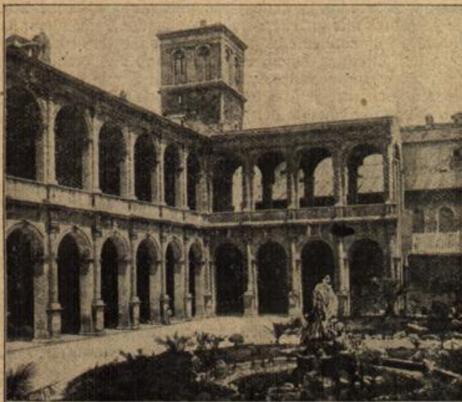
Palazzo Venezia in Rom,

der Sitz der österr.-ungarischen Gesandtschaft am päpstlichen Stuhl, wurde von der italienischen Regierung enteignet.