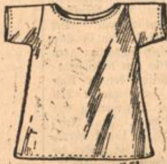
Mod. 750. Knabenhemdchen.