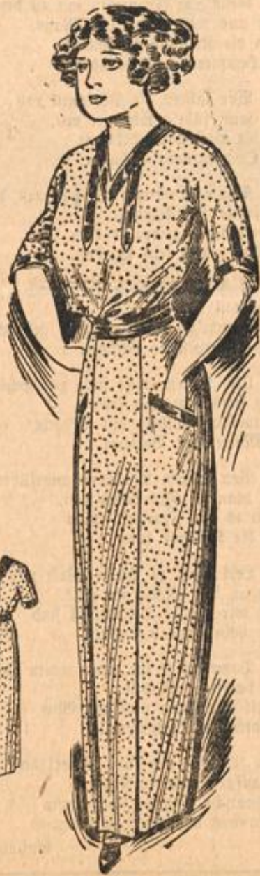
Mod. 790. Kleiderschürze.