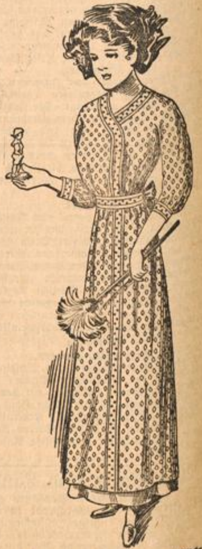
Mod. 792. Kleiderhülle für junge Mädchen.

zogene Häubchen aus weichem Punktmaul wird vorn durch ein doppeltes Spitzenplüsch geziert und ist außerdem mit rotem Seidenband ausgestattet.