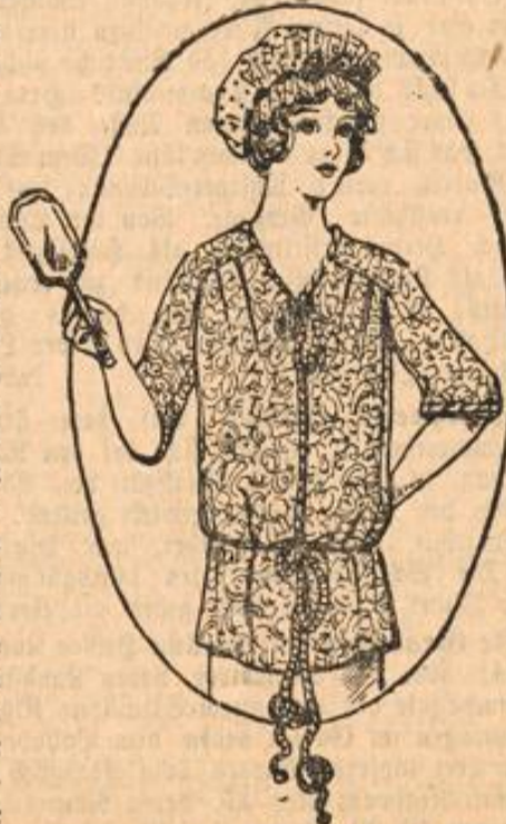
Mod. 864. Morgenjade u. Häubchen.

790. Kleiderschürze. Material: 3 1/2 m Stoff, 1/2 m Satin. Wasch- stoff oder Wollmuffel- lin kann zu diesem Modell verarbeitet werden, das aus einem dreibahnigen Rock und einer Kimonobluse be- steht, beide schließen in der hinteren Mitte. Den Seitenbahnen des Rockes sind schräge Taschen einzuschlagen. Eine unifarbene Blende begrenzt den spitzen Ausschnitt, den unteren Rand der Ärmel und den obern Rand der Taschen.