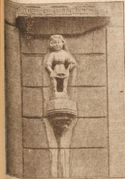
Das „Hungermännchen“ in Bad Blankenburg. (Mit Text.)

einziges, grimmig hervorgestoßenes Wort: „Gemeinheit!“ Der junge Hausherr neigte sich zu dem kleinen Drahtfensterchen: