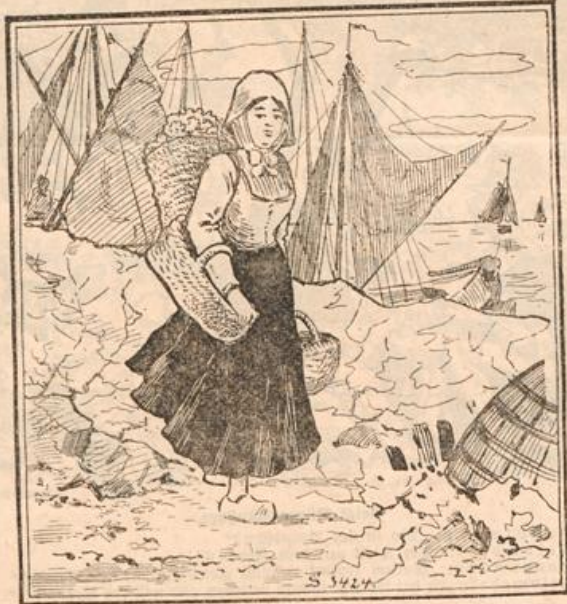
Wo ist der Fischer?

Von den Eiern, die noch während des freien Auslaufs der Hühner ge- wonnen und zur Brut verwendet wer- den, sollen Faulbruten weniger vorkom- men. Auch die Haltbarkeit der Winter- eier zeugt dafür, daß durch Grünfutter die Qualität der Eier gesteigert wird; denn vom Monat August ab wird im allgemeinen den Hühnern wieder der Auslauf in Feld und Garten gestattet, und sie haben dabei noch reichlich Ge- legenheit, Gras und Kräuter zu fressen. Wie sehr den Tieren der „Weidegang“ nützt, zeigt schon die Tatsache, daß sie sich, sobald sie einmal vom Hof herunter können, mit wahrer Gier auf eine Ra- senfläche stürzen. Das erklärt sich wohl daraus, daß das Gras sowohl wie der Salat großen Nährsalzgehalt besitzt, der den Hühnern nicht nur selbst dienlich, sondern auch zur Eierproduktion notwen- dig ist. So treibt der natürliche Instinkt die Hühner auf die Weide.