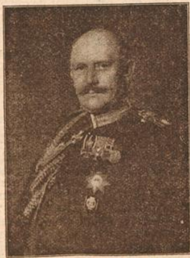
Generaloberst Helmuth v. Moltke, Chef des Generalstabes der deutschen Armee. (Mit Text.)