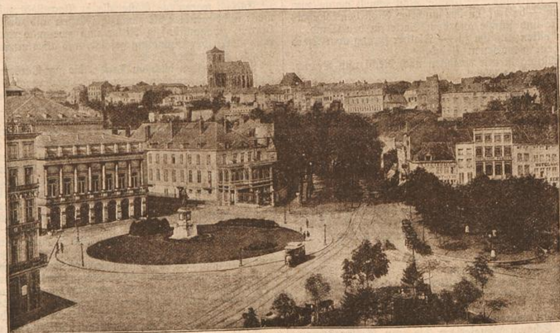
Das erstürmte Lüttich. (Mit Text.)

wiesen sich machtlos gegen das Fieber. Da sandte sie zwei Knechte mit geheimer Botschaft, den einen an Diether von Melsheim, den andern ins Kloster der Benediktinermönche, daß ein frommer heilkundiger Bruder komme, um der Tochter zu helfen. Ein Gutes brachte Irmgards Krankheit dem Mädchen: sie konnte nicht mehr gezwungen werden, dem