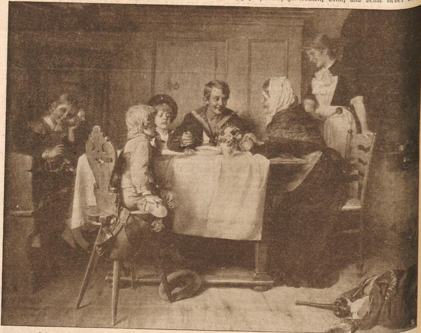
Heimgelehrt. Von J. E. Rosenthal. Photographie im Verlag von Franz Hanfstaengl in München. (Mit Text.)

Ehe und während unserer kurzen Brautzeit gar sorgfältig zu verbergen wußtest; so wie Eigensinn, Bosheit und alles mögliche. Ja! Und rechthaberisch bist du auch!“ „Was heißt rechthaberisch? Das ist gut! Vergiß es nicht, ich bin der Herr!“ „So? Und ich die Sklavin, nicht? O Gott, o Gott! Wie bist du unglücklich! Und was hast du mir alles versprochen? Auf den Händen wolltest du mich tragen und — und jetzt —“ „Habe ich das etwa nicht getan? Aber schau, Maus, auf die Dauer wird's einem doch schwer —“ „Verhöhnst du mich auch noch! Warum quälst du mich so? Ich — ich kann doch nicht dafür, daß Gabriele wiederkommen will —“ „Jetzt hör auf zu weinen, Erna, und denke lieber darüber