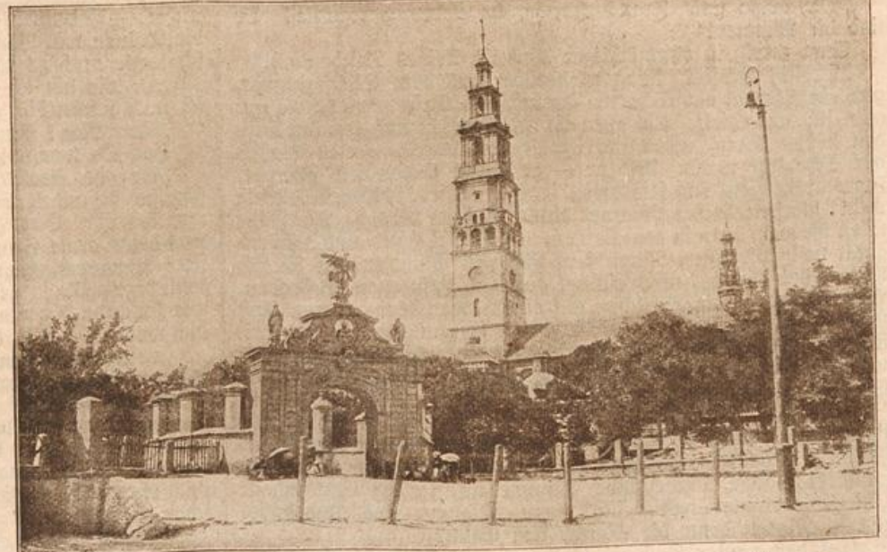
Zur Einnahme Fischstochhaus durch die deutschen Truppen. (Mit Text.)