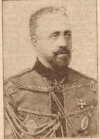
Großfürst Nikolaj Nikolajewitsch, ein fanatischer Deutschenshaffer. (Mit Text.)