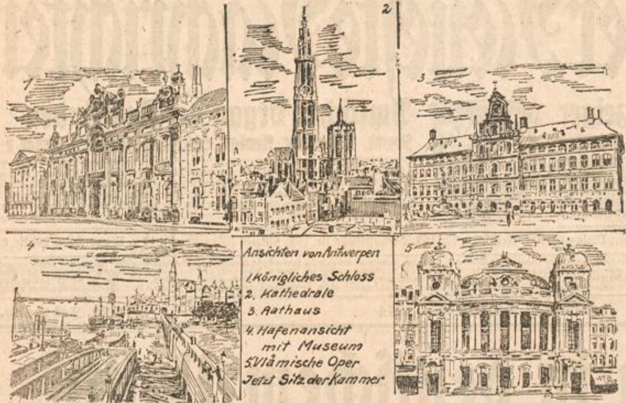
Ansichten von Antwerpen 1. Königliches Schloss 2. Kathedrale 3. Rathaus 4. Hafensicht mit Museum 5. Vlaemische Oper Jetzt Sitz der Kammer

kunst aufgeben. Der materielle Schaden, den die Antwerpener sehr zwecklos und mutwillig angerichtet haben, dürfte sich auf einige hundert Millionen Mark belaufen. Selbstverständlich muß Antwerpens Bevölkerung, insbesondere die dort anässigen heimischen und ausländischen Handelshäuser, den Schaden beden, der — da es sich um die Zerstörung von Schiffen handelt — den Stempel der Niedertracht englischer Anstiftung trägt. Die Engländer und ihr Rat werden dem belgischen Lande wahrlich teuer werden.