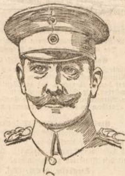
Gen.d.J. v. Beseler, der Belagerer Antwerpens.

General von Beseler, der Oberkommandant der Belagerungsarmee, hat einen Erfolg zuwege gebracht, der alle Festungsüberoberungen, die die Weltgeschichte bisher verzeichnete, übersteigt. Ein so schneller und nach vorhergerechneter Pläne unbedingt sicher und genau durchgeführter Abbau einer Festung von der Bedeutung Antwerpens war bisher unbekannt. Man darf daher, ohne als Propheten gescholten werden zu müssen, sagen, daß mit den Forts von Antwerpen die schon durch Lüttich und Namur wankend gewordenen Anschauungen über den Wert von Festungen vollends zusammengeschossen wurden. Ein Neues steht auf, das schon in der Bildung begriffen ist: die Befestigung der Truppenstellungen auf dem jeweiligen Schlachtfelde selbst, die schnell hergestellte Befestigung des offenen Feldes unter Benutzung natürlicher Vorteile wie Hügel, Felsen, Wald, Wasser, Sumpf. Bei dem großen Ningen in Galizien und deutlicher noch bei den Dauerkämpfen in Nordostfrankreich steigt das Bild einer neuen Kriegstechnik schon in scharfen Umrissen empor. Freilich ist es fraglich,