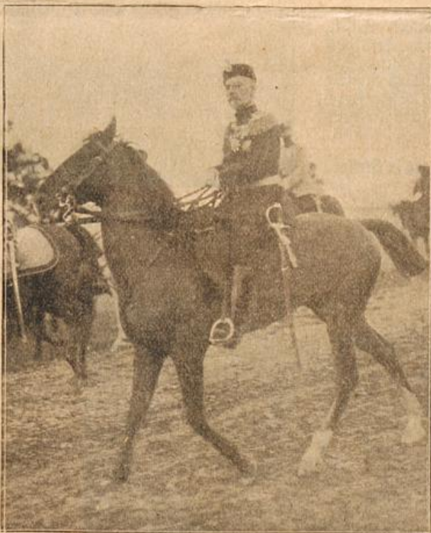
Der serbische Generalstabschef General Putnit der zur Erholung in Ungarn weilte, wurde auf der Rückreise nach Belgrad von den österreichischen Behörden verhaftet, aber auf Veranlassung Kaiser Franz Josefs wieder freigelassen und ihm ein Extra-Zug zur Verfügung gestellt.