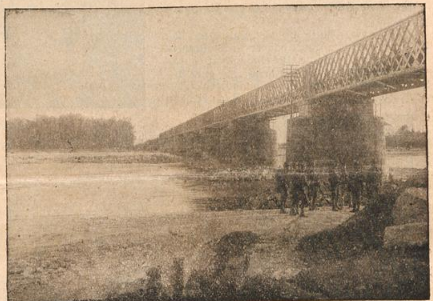
Die österreichische Sabebrücke bei Semlin. Die 400 Meter lange Brücke über die Save, die Semlin mit Belgrad verbindet, ist ein äußerst wichtiger strategischer Punkt. Sie wurde gleich in den ersten Kriegstagen von den Serben in die Luft gesprengt. Die Brücke trug die Gleise der Orientbahn Wien—Konstantinopel.

„Wozu lebt man eigentlich auf der Welt?“ sagte Kocziorowski. „Man kommt — man weiß nicht woher. Man wird vom Winde getrieben und dann auf irgendeine Scholle geworfen, auf der man mühselig Halt sucht, und dann vergeht man wieder, ohne daß man recht weiß, wozu das ganze Dasein einen Zweck gehabt hat!“ Annemarie sah bei dem bitteren Klang seiner Worte von der Handarbeit auf, die in ihrem Schoß lag. „Aber Herr von Kocziorowski, — so verbittert? Sie haben doch noch Ihr ganzes Leben vor sich — und Sie mir von Ihren Zukunftsplänen erzählt? Sie sieht doch gerade Ihnen ein schönes Feld der Tätigkeit bevor. Denken Sie doch, wieviel Gutes Sie durch die Verwaltung seines riesigen Besitzes völlig freie Hand lassen, und da können Sie doch schalten und walten, als ob Sie der Herr selbst wären!“