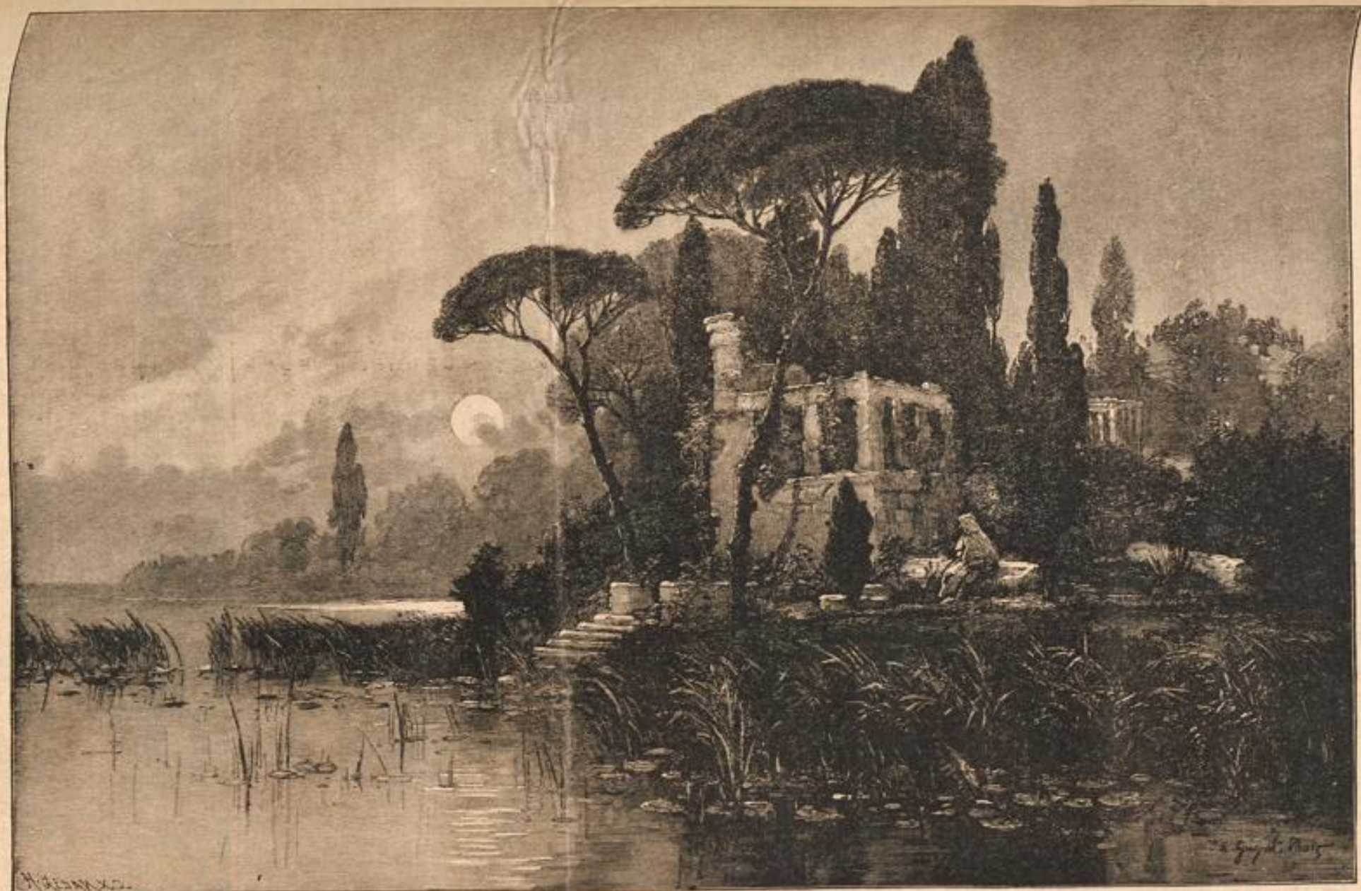
Mondaufgang am See. Nach dem Gemälde von J. C. Guyot.