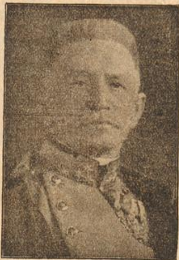
General der Infanterie Konrad v. Hoekendorff

der Chef des österreichisch-ungarischen Generalstabs, ein vorzüglicher Taktiker, der zu den Vertrauten des Erzherzogs Franz Ferdinands zählte.