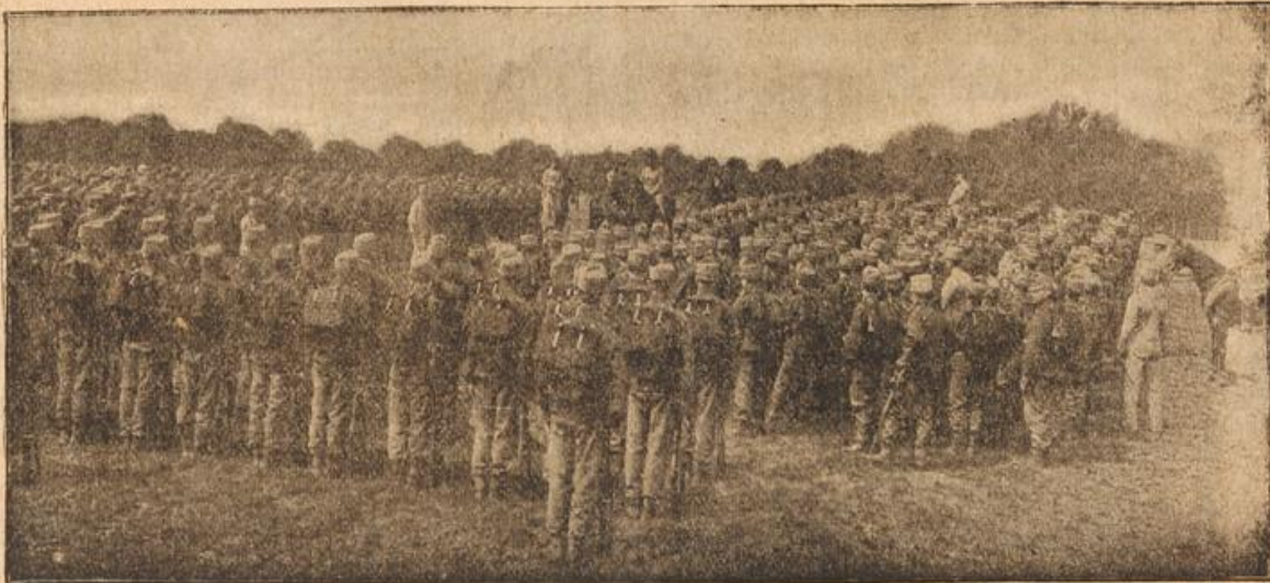
Ansprache eines österreichischen Regiments-Kommandeurs an sein Regiment vor Beginn des Kampfes.

Annemarie fand immer mehr Gefallen an dem neuen Hausgenossen. Denn wenn Sinskes Nachfolger auch mit dem Abzuge der Familie Sinske vom Verwalterhause Besitz ergriffen hatte, so kamen sie doch täglich zu den Mahlzeiten zusammen, die er nach wie vor im Schlosse einnahm. Koczierowski war mindesten ein ebenso guter Reiter wie der Vitauer, und in seinen übrigen Eigenschaften stach er unendlich zu seinem Vortelle gegen diesen ab. Seine vornehme, schlankte Erscheinung zog oftmals ihre Blicke auf sich, wenn der junge Mann auf dem Hofe den Leuten seine kurzen, bestimmten Anweisungen gab, und die Abende, die ihr früher in der Gesellschaft ihrer Großeltern gar oft trübselig und lang erschienen waren, verliefen ihr jetzt in seiner Gesellschaft viel kurzweiliger.