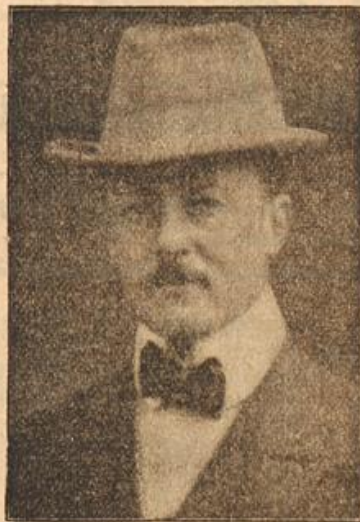
Freiherr v. Berchtold

der österreichisch-ungarische Minister des Auswärtigen und Leiter des energischen Vorgehens gegen Serbien. Er bekleidet seit Anfang 1912 sein verantwortungsvolles Amt.