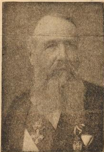
Der serbische Minister-Präsident Nicola Pasitsch der dem österreichisch-ungarischen Gesandten in Belgrad die ungenügende serbische Antwort überreichte.

Blonde Frauen reizten ihn eigentlich nicht. Und die blauen Augen Annemaries, die so ruhig und sicher in die Welt blickten, hatten für ihn auch nichts Anziehendes.