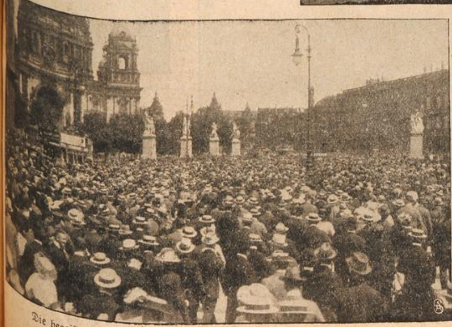
Die begeisterte Menge beim Aufziehen der Schloßwache im Lustgarten.

„Als ob —, sehen Sie, Baroneß, dieses „als ob“ ist es ja gerade!“ Ich könnte heut auf eigener Scholle sitzen, wenn nicht — aber lassen wir das. Ich will nicht daran denken an unser geliebtes Czernowice; wir haben es seit Jahrhunderten besessen. Zur Schlacht von Lannenberg ritt mein Urahne zum Heere seines Königs von Czernowice aus — und der letzte seines Stammes muß sein Brot bei fremden Leuten essen. Die Scholle meiner Väter wird heute von fremden, deutschen Ansiedlern heudert; der Besitz ist zerrissen und zerstückelt, da, wo früher der polnische Elchitz die unumgrenzte Herrschaft ausübte, sitzen heute kleine Bauern, die nicht einmal mehr die Jagdgerechtigkeit auf den einzelnen Höfen haben.“