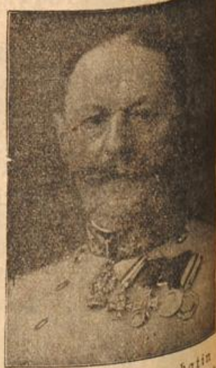
Feldzeugmeister Ritter v. Probatin Leiter des Kriegsministeriums für Oesterreich und Ungarn, an dessen Spitze er 1912 als Nachfolger des Ritters v. Aussenberg berufen wurde.

der ihm blindlings traute, ihn für sein ganzes Leben sicherstellen würde, mußte er im voraus. Möchte es dann kommen, wie es wollte, er würde jedenfalls für alle Zeiten gedeckt sein. Es gab Fälle, wo Leute, die in solchen Vertrauensstellungen waren, wie ihm eine bevorstand, mit hohen Abfindungssummen abgelöst werden mußten, wenn es einmal zum Bruche kam, und man mußte eben auf alle Fälle sicher gehen! Aber in den Wochen, die er nun in Malchentin tätig war, waren ihm doch Zweifel darüber aufgestiegen,