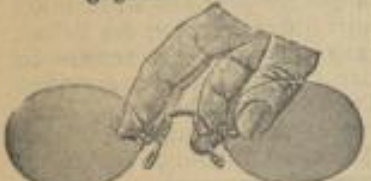
Photo-Handlung Bockenheimer, Leipzigerstr. 16

H. Hachemeister Optisches Institut gegründet 1883.