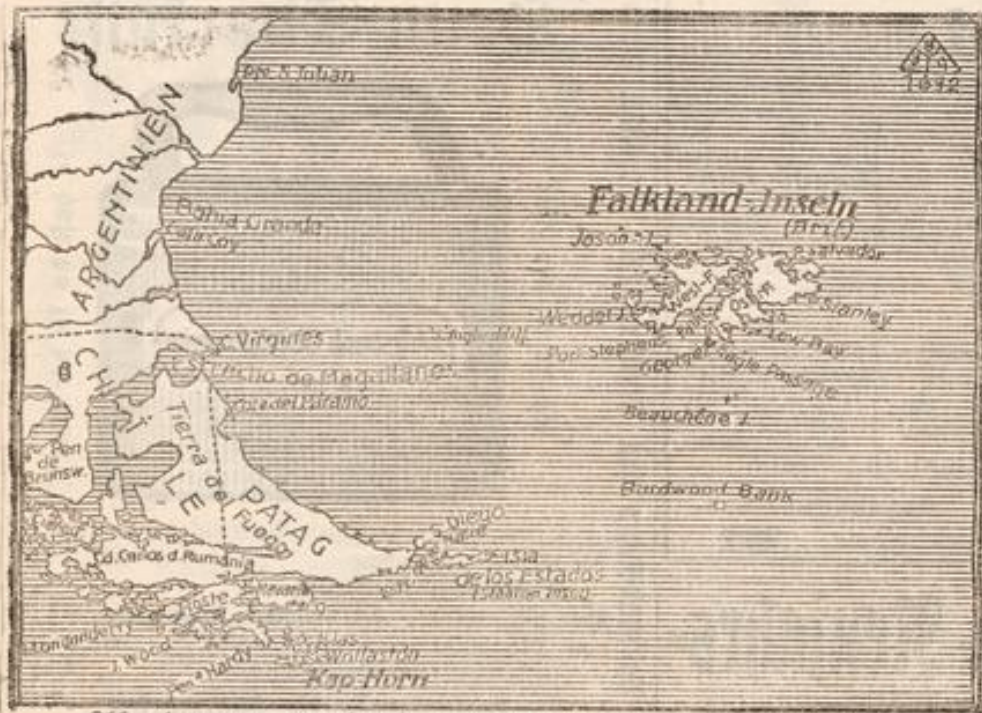
Karte zur deutsch-englischen Seeschlacht