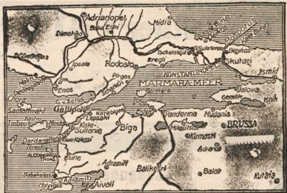
Von den Dardanellen zum Bosporus