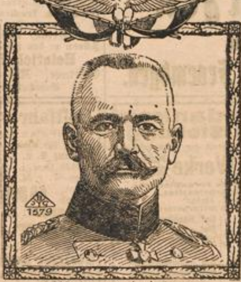
Kriegsminister Generalleutnant v. Falkenhayn