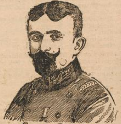
Enver Pascha Generalissimo d. türkischen Armee