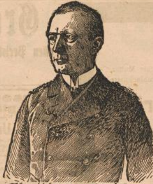
Kapitän von Müller der mutige Führer der „Emden“