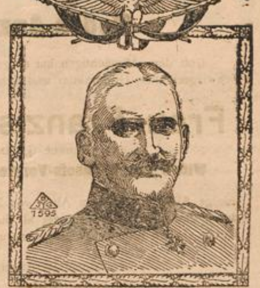
General von der Goltz

Man, von denen im Oktober dieses Jahres erst ein Teil eingestellt wurde. Den englischen Truppen von angeblich 1 200 000 Mann stehen also in Deutschland und Oesterreich-Ungarn viereinviertel Millionen Mann gegenüber.