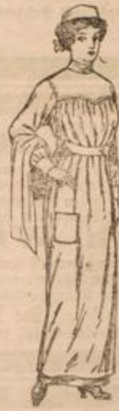
Nr. 12193. Operationskleidung für Schwestern.

Tausend fleißige Hände regen sich noch emsig, um all die für die Lazarette nötigen Gegenstände herzustellen. Da Hilfs-schwester und solche Pflegerinnen, die nur für die Kriegszeit ein-gestellt zu werden wünschen, sich ihre Schwestertrachten selber beschaffen müssen, so möchten viele sie selber im eigenen Hause anfertigen. Zu einer guten Ausrüstung gehört entschieden auch eine Operations-schürze, wie sie unsere Abbildung veranschaulicht. Aus weichem Leinen oder gleichem baumwollenen Stoff gearbeitet, erhält sie eine geschweifte Pass, der der untere Kermel und der Halsauschnitt schließen mit einem Bändchen ab, und Gürtel sowie Tasche vervollständigen die Ausstattung der einfachen Schürze. Die Vorlage kann von jeder Dame mit Hilfe eines Favoritschnittes mühelos nachgearbeitet werden. Schnitt unter Nr. 12193 in 44, 48, 52 cm halber Oberweite für 60 Pf. zu beziehen von der Modenzentrale Dresden-N. 8.