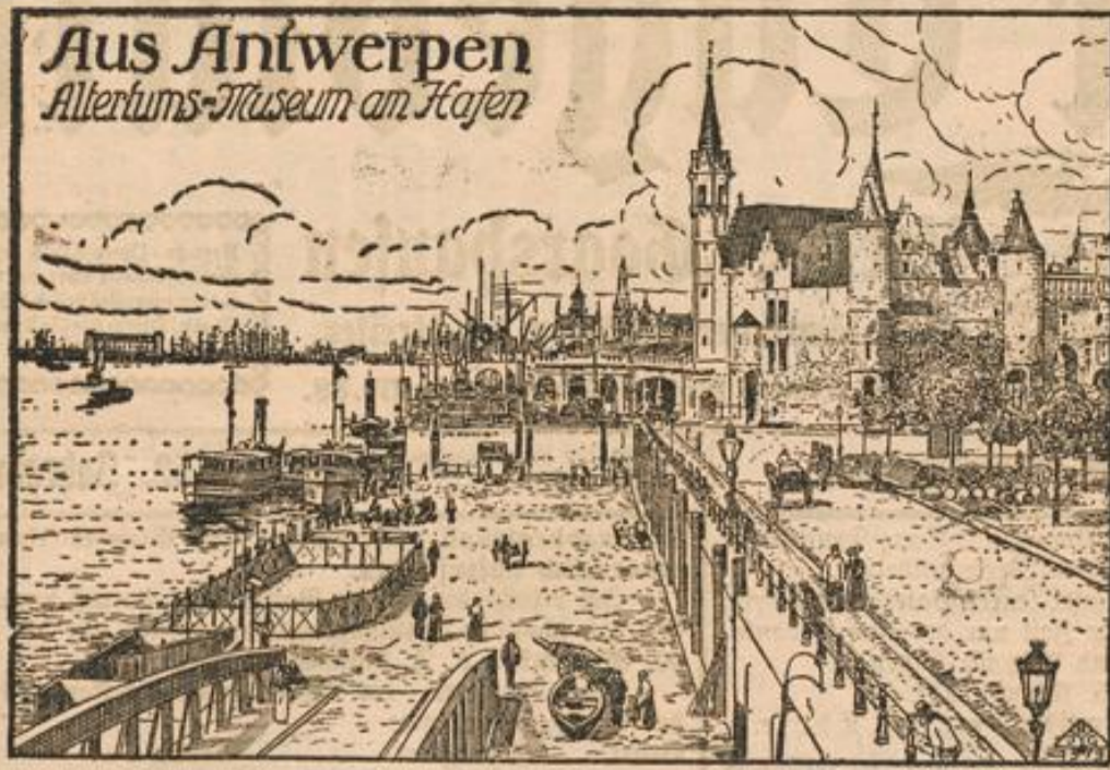
Aus Antwerpen Altertums-Museum am Hafen