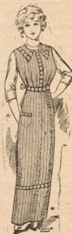
Zierschürze mit reich. Stickerei moderne Form 95 Pf.