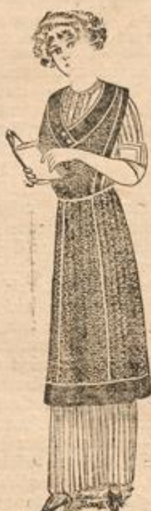
Zierschürze Satin mit türk. Vordüre 95 Pf.