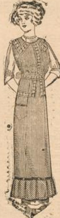
Blusenschürze mit Volant u. Tasche sowie apart. Garnitur 95