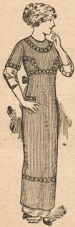
Blusenschürze vollweil, mit Volant und Tasche 95 Pf.