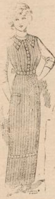
Zierschürze mit reich. Stickerei moderne Form 95 Pf.