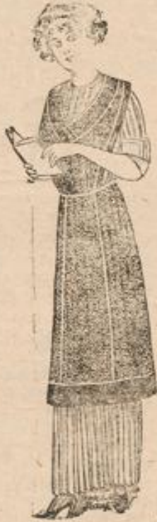
Zierschürze Satin mit türl. Bordüre 95 Pf.