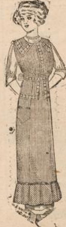
Blusenschürze mit Volant u. Tasche sowie apart. Garnitur 95