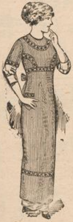
Blusenschürze vollweit, mit Volant und Tasche 95 Pf.