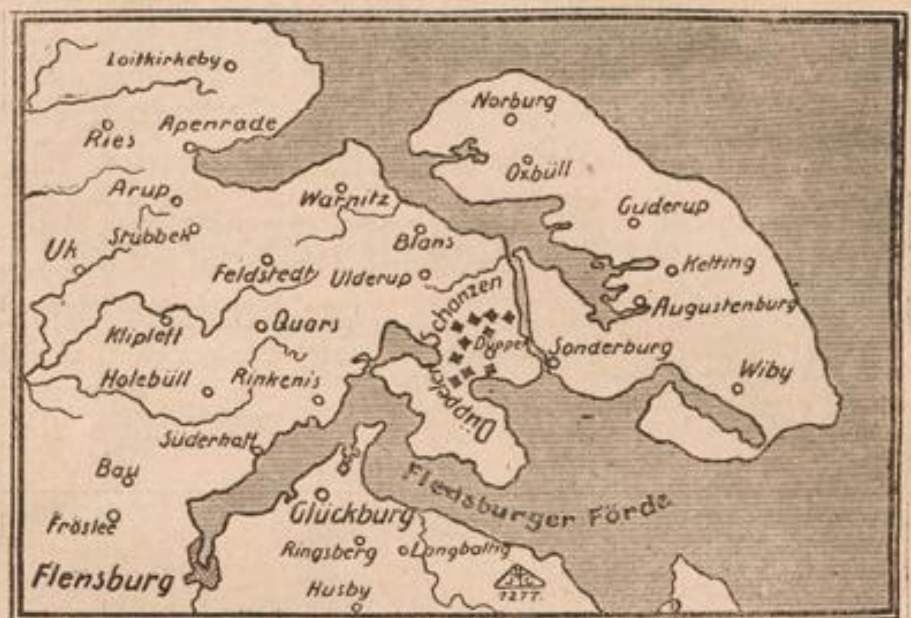
Zur Erinnerung an den deutsch-dänischen Krieg 1864. (Die Duppeler Schanzen)

Die Affaire in Zabern hat ihre Opfer gefordert. Der Statthalter Graf Wedel, sowie der Staatssekretär Zorn von Bulach traten von ihren Posten zurück. Als Kandidaten für den Statthalterposten werden jetzt von Schorlemer, von Rheinbaben und Fürst Ernst von Hohenlohe-Sangerhausen genannt.