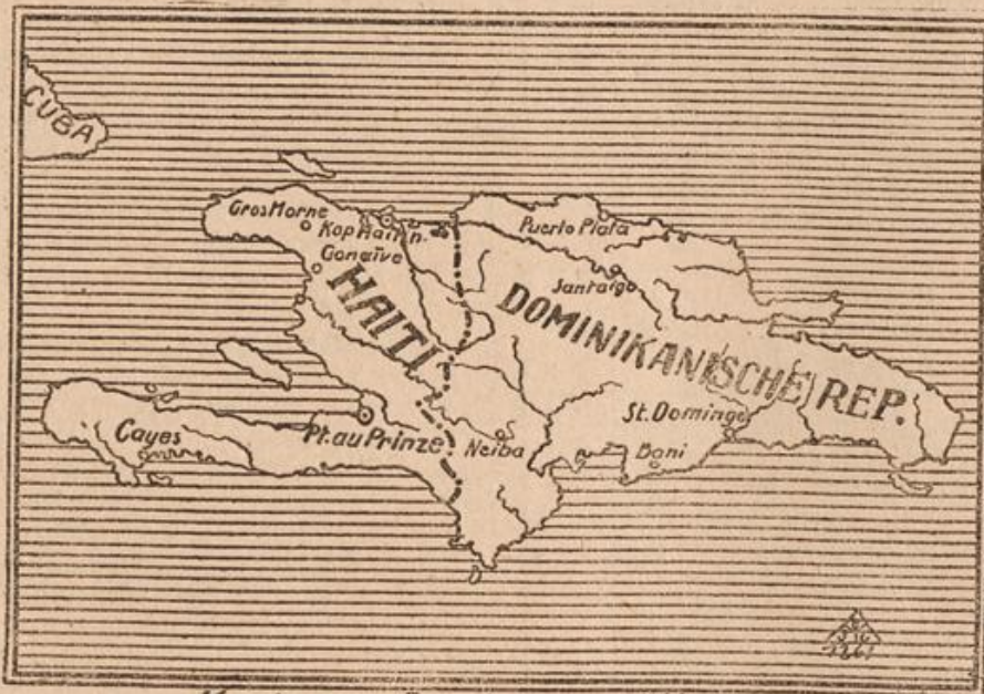
Karte zur Revolution auf Haiti.

Am 1. Februar 1864 überschritten die Preußen die deutsche Grenze, womit der Krieg seinen Anfang nahm. Wir bringen zum 50. Gedenntage die Bilder zwei zum Gedächtnis errichteten Denkmäler.