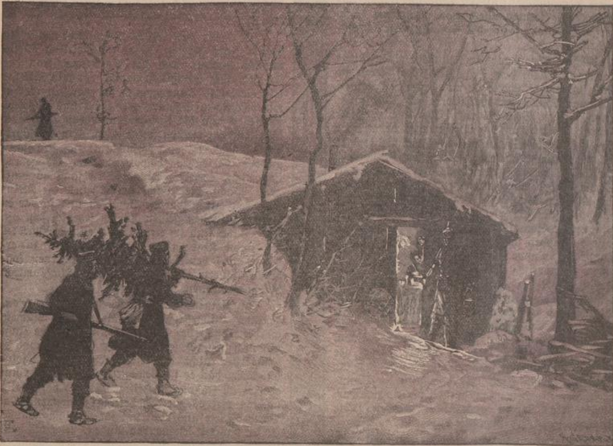
Weihnachten in Feindesland.

Wochen vor Weihnachten. Das Christkind, das nun bald kommen sollte, war uns sehr nahe. Wir meinten, es am Fenster vorbeifliegen zu sehen, unsere Herzen waren erfüllt von Weihnachtsvorfreude. Meine Mutter machte sich dann wohl im Nebenzimmer zu schaffen, als ob sie etwas suchte oder holen wollte. Zurückkommend rief sie: „Kinder, was liegt hier auf dem Fußboden?! Ich meine, das Christkind hat etwas verloren!“ Schon waren wir aufgesprungen, krochen im Halbdunkel auf den Dielen umher und fanden, was da verstreut lag. Kleine Weihnachtsplätzchen oder Nüsse. — Am Vorabend des Nikolaustages holten wir alle einen unserer Sonntagsstiefel herbei. Wir Jüngsten bedauerten dann immer, daß unsere Füße noch so klein waren,