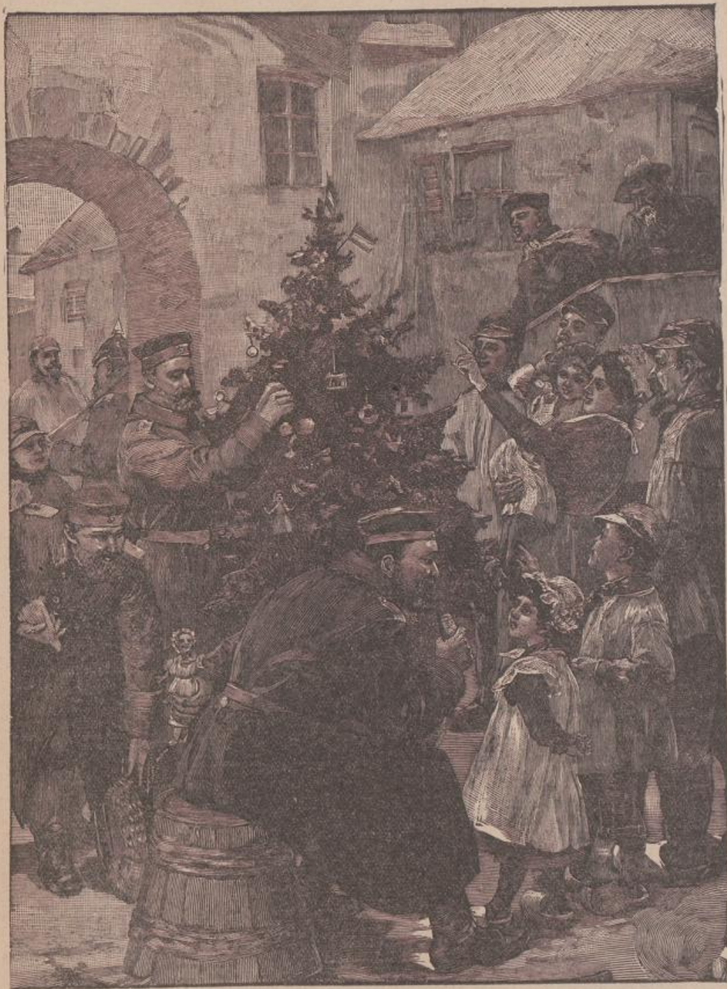
Kriegsnot und Liebeslicht.

bei ist doch das Wichtigste, daß, wenn Weihnachten gefeiert wird, auch im Feindesland, wo der Christbaum brennt und die Bewohner des von uns besetzten Landes an unseren Feiern teilnehmen, sie etwas spüren von dem Weihnachtssegen der Liebe Christi, von dem deutschen Glauben an den Heiland der Welt, den Erlöser und Versöhner aller Menschen. Das Weihnachtsfest im Feindesland sollte ein Weihnachtsevangelifationsfest werden, wo durch die Tat der Liebe, wie durch Worte der Liebe das Evangelium Jesu Christi gepredigt wird, damit auch die, die ihm fern waren, nahekommen und durch seine Gnade